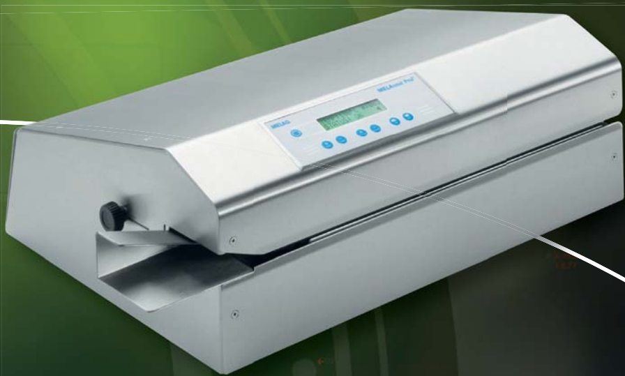
Soudures MELAseal ® Pro

essentiel de ne pas se tromper, la durée