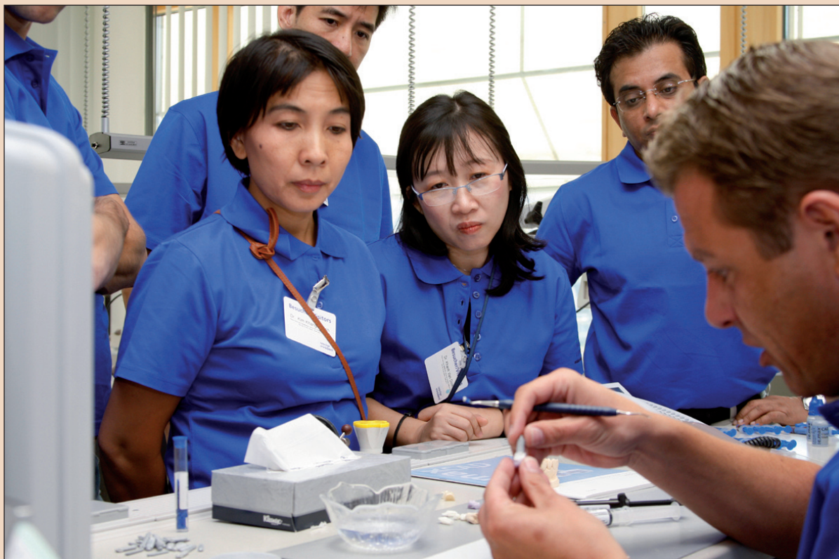
Ivoclar Vivadent: 2220 munkatárs világszer- te.

Világszer- te több mint 15 továbbképző központ segíti a magas tudásszint elérését az Ivoclar Vivadent termékeinek és rendszereinek alkalmazásá- hoz.