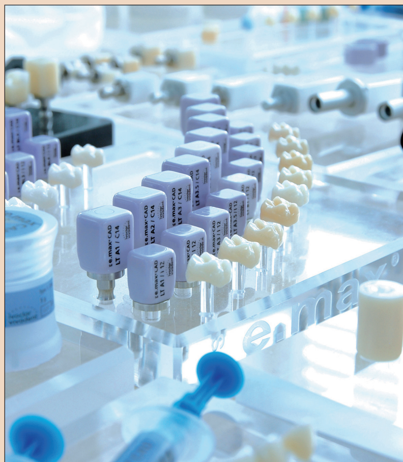
Hosszú évek tapasztalatának s a kiváló Kutatási – Fejlesztési Osztály, eredményeinek köszönhető, hogy az Ivoclar Vivadent minden évben számos újítást dob a piacra.

– Az új bluephase 20i lenyű- gőz 2000 mW/cm 2 teljesítmé- nyével, szenzációsan rövid, 5 mp-es megvilágítási idejével. Az egyedi, Ivoclar Vivadent fejlesztésű polywave LED technológia