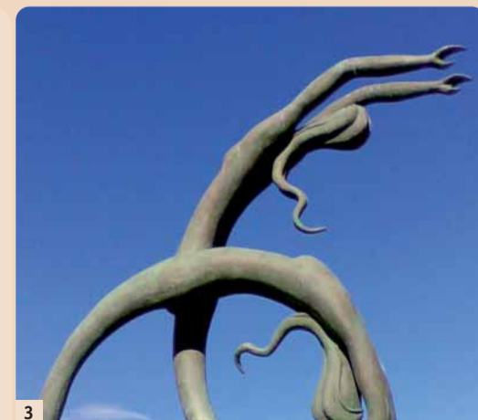
Das weibliche Schlankeitsideal künstlerisch dargestellt. (Skulptur: Hafenpromenade in Heraklion, Kreta. Foto: Prof. Dr. Peter Keel)