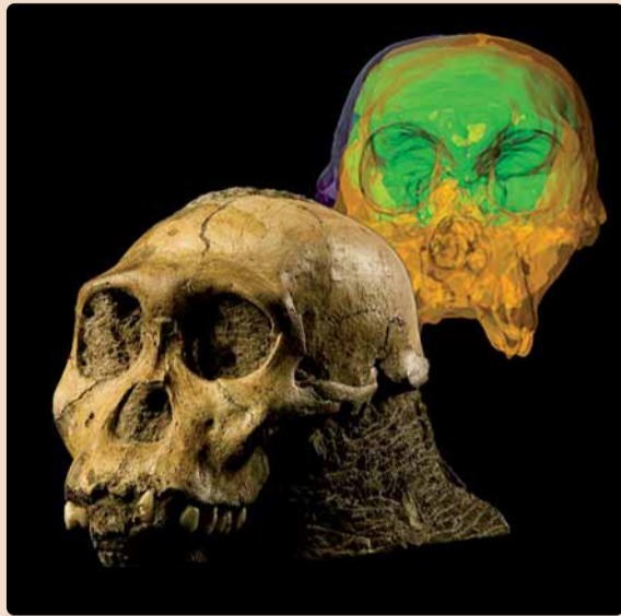
Schädel MH1 von Australopithecus sediba (Original) mit der virtuellen Präparation des Hirnraums im Hintergrund.