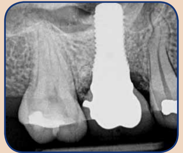
10 Month Post-LAPIP protocol