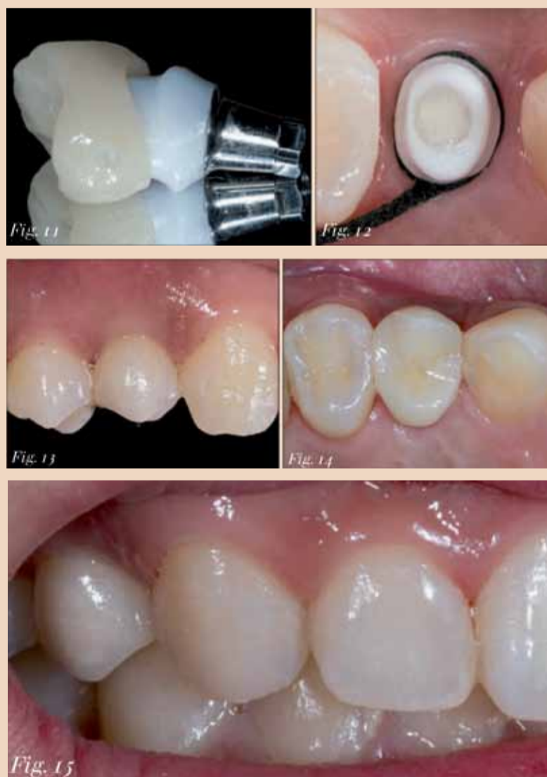
Fig. 11: The abutment cemented to the titanium base and the completed crown (IPS e.max CAD).— Fig. 12 & 13: After placement of the abutment, the all-ceramic crown was permanently luted in the oral cavity.— Fig. 14: Occlusal view after the insertion of the crown.— Fig. 15: Labial view. The implant crown blends smoothly into the natural dentition. Similarly, the composite restoration is barely visible to the naked eye.