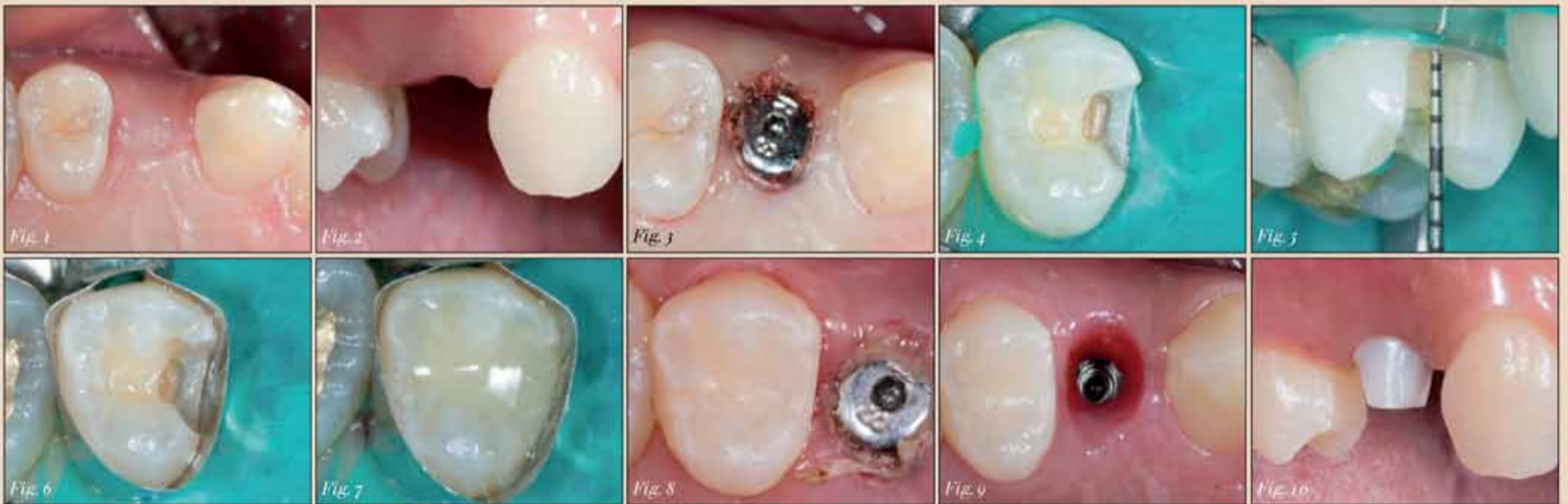
Figs. 1 & 2: Initial situation—osseointegrated implant in the premolar region.— Fig. 3: During exposure of the implant, a mesial carious lesion was observed in the adjacent premolar.— Fig. 4: Caries in tooth 15 was removed and a rubber dam was placed in preparation for the restorative treatment.— Fig. 5: The measuring results produced with a periodontal probe showed a cavity depth of 4 mm.— Fig. 6: After placement of a matrix band, the adhesive was applied.— Fig. 7: The cavity was filled with only one layer of bulk-fill composite (Tetric N-Ceram Bulk Fill).— Fig. 8: The completed composite restoration in tooth 15 (mesial).— Fig. 9: Two weeks after the implant exposure, it was ideal to take an impression of the situation.— Fig. 10: Try-in of the hybrid abutment.

הסבר שימוש בחומרים מרוכבים במילוי בשלב אחד בשילוב עם חרסינה (קרמיקה) מונוליטית.