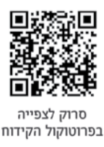
סרוק לצפייה בפרוטוקול הקידוח

אלפא-ביו טכ. גאה להשיק את שתל ה-NICE, שתל צר בקוטר 3.2 מ"מ בעל מערכת שיקומית צרה, המספק פתרון מקיף לרכסים צרים. ה-NICE מאפשר דיוק מירבי, איכות גבוהה ונוחות שימוש למתן פתרון אידיאלי ומשלים לקשת מוצרי החברה.