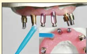
图4, 示范的是使用粘接棒尾端的蜡封闭住种植体转移杆的螺丝孔, 来阻止印模材料卡住螺丝的凹槽。如果印模材料进入到凹槽, 就会有50/50的可能性取不到完整的印模, 进而导致模型不够精准。如果你做过很多种植体并

图3, 示范的是如果利用粘接棒将闭合和开放的种植体转移杆放置到需要弯曲粘接棒才能到达合适的位置。需要再次强调的是, 即使在放置种植体转移杆时, 在把他们拧紧在种植体上的过程中也是很容易滑落的。