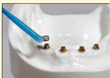
图2, 示范的是将一个微型的用以固位的部件放置到一个微型ERA基台(Stern-gold, Atterbury, Massachusetts)。可以通过使用粘接棒来协助放置他们, 特别是在放置时特别容易滑落的后牙弓位置。

战。我相信我们中有些人在使用微型螺丝来锁定种植体桥支架和/或锁扣时都会有弄掉了一个或多个微型螺丝的不愉快的经历。通过使用粘接棒, 我已经大大减少了滑移的数量。