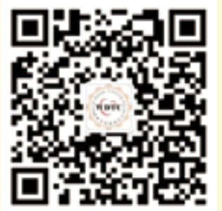
世界牙科论坛微信公众账号