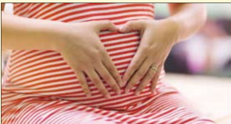
台湾有关方面放宽妇女孕期免费洗牙的举措旨在保障孕妇的口腔健康与胎儿的正常发育。

近日, 台湾“中央健康保险署”(健保署)决定将孕期妇女可享受的免费洗牙服务次数从原来的一次增加到三次。由于荷尔蒙和饮食习惯的改变, 处于怀孕期的妇女更容易发生龋