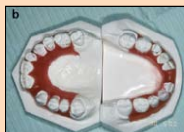
Slika 2. Preterapijski dijagnostički model – a) labijalni pogled, b) okluzalni pogled.