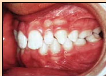
Slika 1a. Klinički prikaz malokluzije na prvom pregledu.