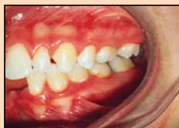
Slika 4a. Klinički izgled okluzije posle skidanja aparata i pre nadogradnje mikrodontičnog gornjeg levog sekutića.