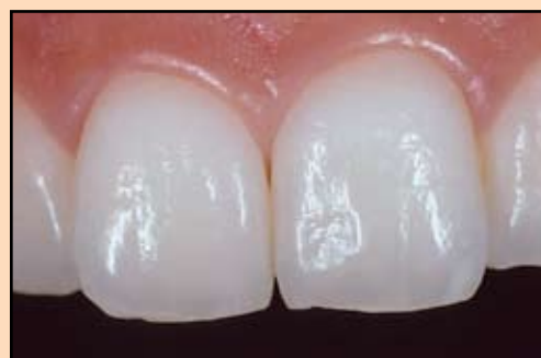
Slike br. 15, 16 i 17 - Varijacije u boji prirodnih zuba. Slab intenzitet boje daje sivkastu boju, srednje vrednosti daju kremasti izgled, dok intenzivnija boja daje beličast.