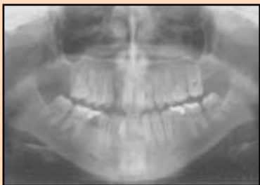
Slika 4b. Radiografski nalaz posle skidanja aparata: ortopantomografski i periapeksni snimci regije sekutića.

Ovo je posebno važno u terapiji hipodoncije kod adolescenata zbog produženog trajanja tretmana. Ovo ilustruje i naš prikaz 19-godišnje belkinje, kod koje je bilo neophodna kombinacija ortodontije, oralne hirurgije i restaurativne stomatologije za uspešan ishod tretmana njene izrazite hipodoncije. DT