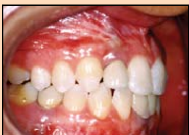
Slika 6a. Klinički izgled okluzije, pacijentkinja stara 21 godinu, 2 godine posle postavljanja implantata i fiksnih nadoknada.