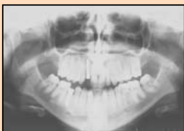
Slika 6b. Ortopantomografski nalaz, 2 godine posle postavljanja implantata i fiksnih nadoknada.

bilo kog slučaja hipodoncije su poboljšanje estetike i uspostavljanje mastikatorne funkcije, pri čemu su oba postignuta kod prikazane pacijentkinje.