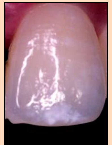
Slika br. 20 - Tipični opalescentni efekat gleđi. Na fotografiji se vidi tipičan plavičasti halo okružen sa opalescentnom gleđi. U incizalnoj trećini postoji intenzivna mrlja na gleđi, a cela površina je pokrivena sa beličastim pahuljičastim opalescencijama.

u translucentnoj gleđi koji reflektuju i rasipaju svetlost tj. manje talasne dužine se reflektuju i prave plavičast odsjaj zuba. Kod prirodnih zuba ovo se obično pojavljuje na ivicama incizalne trećine, gde uglavnom nema dentina i tu se pojavljuje poznati plavičasti halo oko zuba. Kako debljina dentina raste, to se više talasnih dužina reflektuje što utiče na pojavu sivkastog do beličastog odsjaja. (slika 21.)