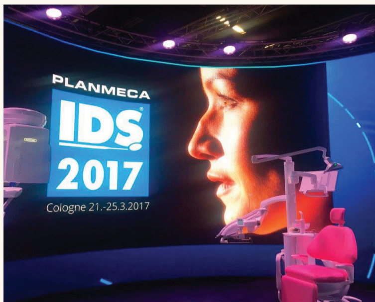
Една от основните атракции на щанда на Planmeca беше презентацията Dream Clinic Show.

Г-н Локки, Planmeca е разработила голям брой нови продукти, които представя за първи път на IDS 2017. Кои от тях са особено значими?