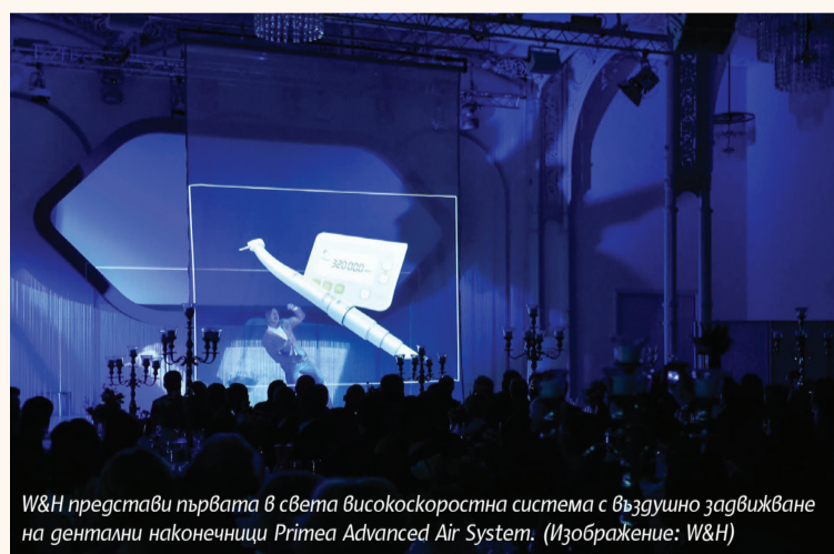
W&H представи първата в света високоскоростна система с въздушно задвижване на дентални наконечници Primea Advanced Air System.