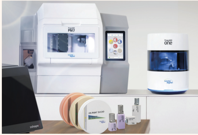
Портфолиото на Ivoclar Digital включва серия фрезовъчни апарати и CAD/CAM материали.

Нарастващата дигитализация на денталния работен процес изисква оптимална координация на всички отделни компоненти. По тази причина Ivoclar Vivadent разшири портфолиото си от материали и експертиза в производството, като сега продуктите на компанията обхващат цялата дигитална верига. Новият бранд Ivoclar Digital беше представен за първи път по време на IDS 2017. „Това е резултат от непрестанна развойна дейност благодарение на значителната ни експертиза в сферата на дигитал-