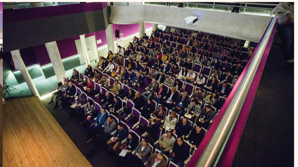
200 дентални специалисти поживаха всяка дума на лекторите на Dawson Academy.