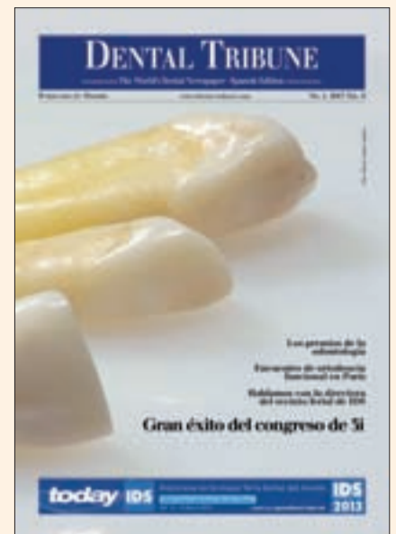
Portada del primer número de Dental Tribune Spain editado por Ripano.

Además, es la editorial de reconocidas organizaciones científicas internacionales como ALODYB (Asociación Latinoamericana de Operatoria Dental y Biomateriales), ALOP (Asociación Latinoamericana de Odontopediatría), SPO (Sociedad Peruana de Odontopediatría), AIO (Asociación Iberoamericana de Ortodontistas), IFUNA (International Functional