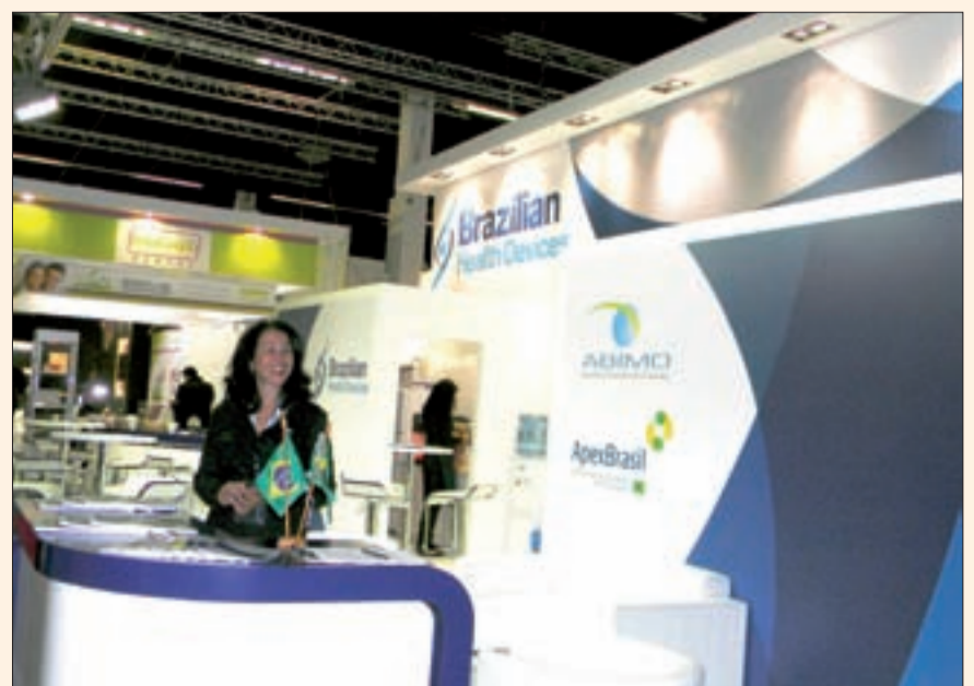
El área de recepción de ABIMO, la asociación de la industria médica y dental de Brasil.