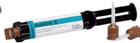
Multilink ® N 通用型高强度树脂水门汀