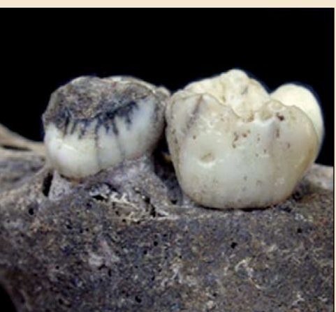
研究人员仔细检查了类似这种在泰国发现的牙齿化石。

研究人员在报告中评论道：“结果显示龋齿发病率的异质性并未与遗址时间推移保持一致，这也支持了该地区口腔健康衰退与农业集约化并无明显联系的假设。”因此，他们称口腔健康和农业集约化的关系可能更为复杂。