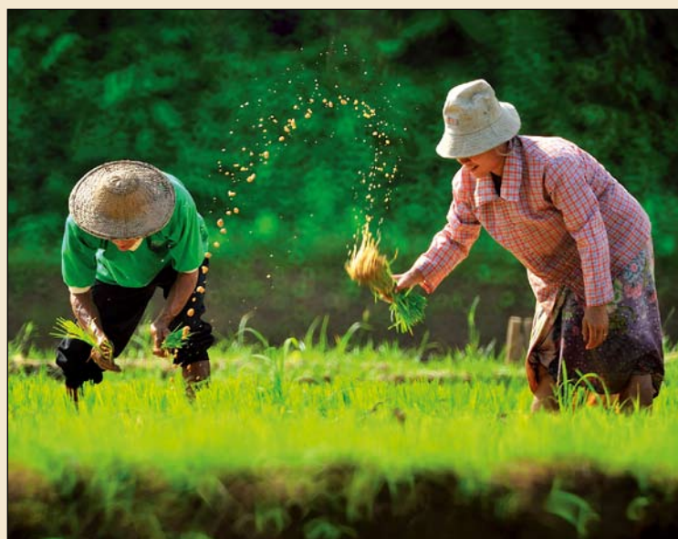
泰国湄宏顺的农民在收获水稻。

然而, 样本中龋齿发病率由于地点的不同而有所不同, 并没有时序性的相应关系, 研究人员指出, 并表明农业和饮食的变化并未像前期所认为的那样对东南亚人口腔健康造成长期影响。不过, 相对恒牙, 乳牙龋齿发