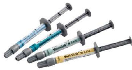
Variolink ® N 多功能美学树脂水门汀