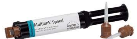
Multilink ® Speed 一步式树脂水门汀

ivoclar vivadent passion vision innovation 义获嘉伟瓦登特公司