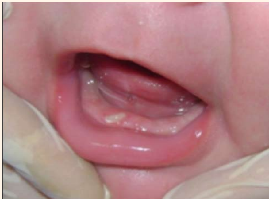
Figura 2. Diente natal distogiroversado 8,1 luego del desgaste de la superficie incisal (Sof-Lex™ Finishing and Polishing Systems. 3M ESPE). Nótase la ulceración blanquecina a nivel de la cara ventral de lengua que contacta con el diente en el momento del amamantamiento.

Al examen radiográfico (técnica de Mannkopf) 4 se notó ausencia de pieza dental 7,1 y presencia de 8,1 con soporte óseo. Fue necesario ampliar la zona radiográfica mandibular a fin de determinar si correspondían a dientes de la serie normal o a supernumerarios. En