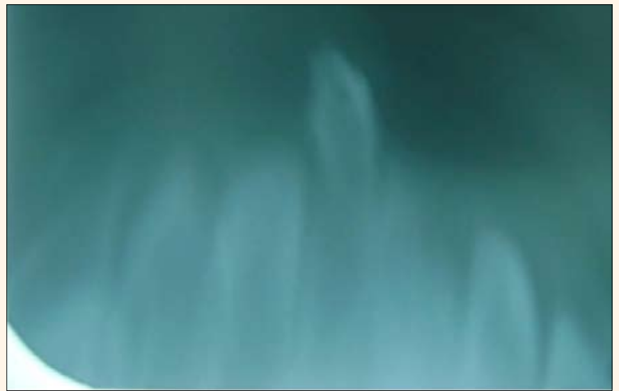
Figura 3A. Primera toma radiográfica (técnica de Mannkopf). Figura 3B. Segunda toma amplia en donde se ve presencia de 8,1 con alteración de estructura adamantina, ausencia de 7,1 y a nivel apical de ambas piezas no se observan otras estructuras. El diagnóstico radiográfico es diente natal 8,1 de la serie normal. No se aprecia 7,1.

nerable ya que su pH estomacal (2,0-5,0) permite el crecimiento de organismos reductores de nitratos ( Escherichia coli , Salmonella spp. etc.) y tienen un alto consumo de agua. La hemoglobina (desde fetal hasta los 6 meses de edad) es más fácilmente oxidada a metahemoglobina que la hemoglobina adulta y el desarrollo del sistema NADH-metahemoglobina reductasa es incompleta 6 .