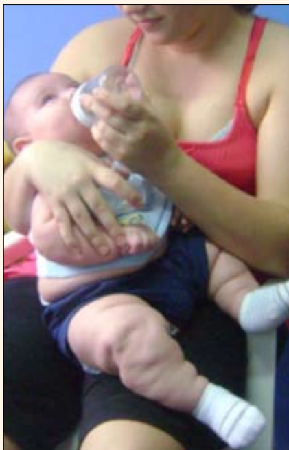
Figura 1. Bebé de 3 meses en consulta odontopediátrica. Nótase el gran tamaño y la abundancia de grasa corporal (peso 8000 grs).

Después de obtener el permiso de ambos padres, procedieron a la intervención. Manifiesta la madre que llevaron al bebé a sala de operaciones. El dentista de guardia realizó la intervención acompañado por un pediatra. La intervención se llevó a cabo bajo las normas comunes de bioseguridad, administrándose anestesia tópica en spray (benzocaína al 20%). El dentista, debido a la movilidad extrema de la pieza dentaria natal presente en la zona de pieza 7,1 (incisivo central inferior izquierdo) y a la pobre movilidad de la pieza natal en la zona de 8,1 (incisivo central inferior derecho), decide retirar sólo el 7,1. No hay datos sobre el procedimiento en sí, pero lo convencional es un corte con tijera quirúrgica que remueve el diente junto con el tejido exófitico, que comunmente lo rodea 5 . Minutos después de la extracción, el bebé presentó cianosis, interpretada en el momento y comunicada inicialmente a la madre como una reacción idiopática; posteriormente el personal involucrado sugiere a la familia que se trató de una reacción a la benzocaína. El bebé fue reanimado y llevado a cuidados intensivos, permaneciendo tres días en el área. La madre relata que los controles médicos pediátricos fueron normales, a excepción de ganancia excesiva progresiva de peso, desde el nacimiento hasta la fecha de nuestra consulta. El bebé al momento de la consulta pesó 8 kgs, con presencia de abundante grasa