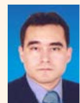
2. Cirujano Dentista, Maestro en Salud Pública. Asociado Fundador de la Asociación Peruana de Odontología para Bebés (Lima, Perú). Profesor de la EAP de Estomatología de la Universidad Alas Peruanas (Lima, Perú).

Profesor Asociado de la Facultad de Estomatología de la Universidad Inca Garcilaso de la Vega (Lima, Perú), y de la EAP de Estomatología de la Universidad Alas Peruanas (Lima, Perú). Ex-presidente de la Asociación Peruana de Odontología para Bebés. Correspondencia: marioeliaspodesta@hotmail.com.