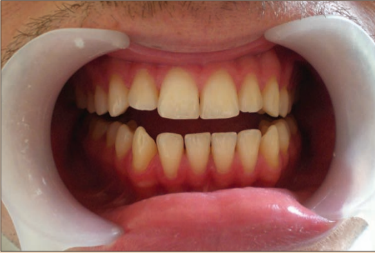
Resim 1. Öncesi.