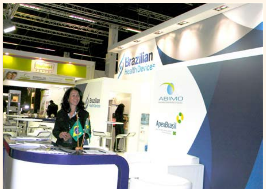
El área de recepción de ABIMO, la asociación de la industria médica y dental de Brasil.