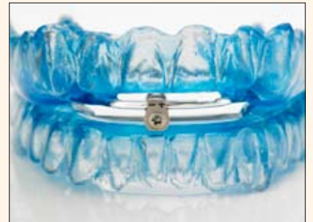
El dispositivo de avance mandibular que evita el ronquido y la apnea del sueño.

“Actualmente, es inevitable tratar el mundo dental desde una perspectiva