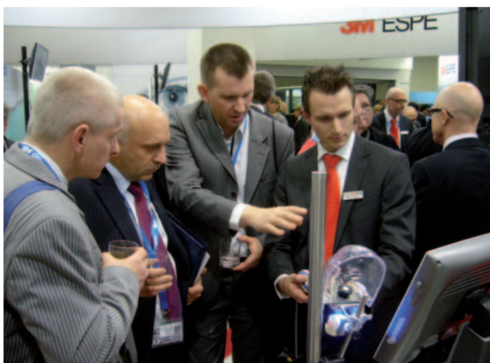
Überragende Technologie am 3M ESPE-Stand – Der Lava Chairside Oral Scanner C.O.S. digitalisiert mit 3 x 20 Bildern pro Sekunde die Zahnsituation im Patientenmund. Ein Gipsmodell wird überflüssig und der Zahntechniker erhält stereolithografische Präzisionsmodelle, auf denen er arbeiten kann.

DeguDent rückt Kostenkontrolle und flexible, schnelle Produktionszyklen ins Blickfeld: Zusätzlich zur Scan- und Fräseinheit „Circon brain“ führt der Hersteller ein separates CAD-Modul zur virtuellen Gerüstmodellation ein, das bei Bedarf