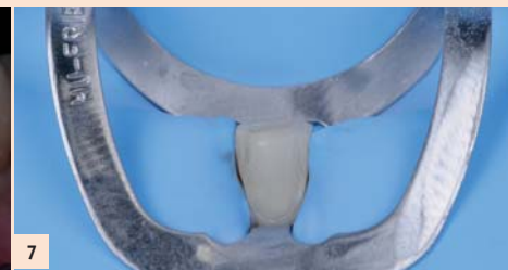
Fig. 7 : Le collage est individuel, en alternance, chaque facette étant réessayée, ajustée si nécessaire au niveau des points de contact. La boîte d'organisation permet de travailler en toute quiétude et d'être le lien entre l'assistante et le dentiste.