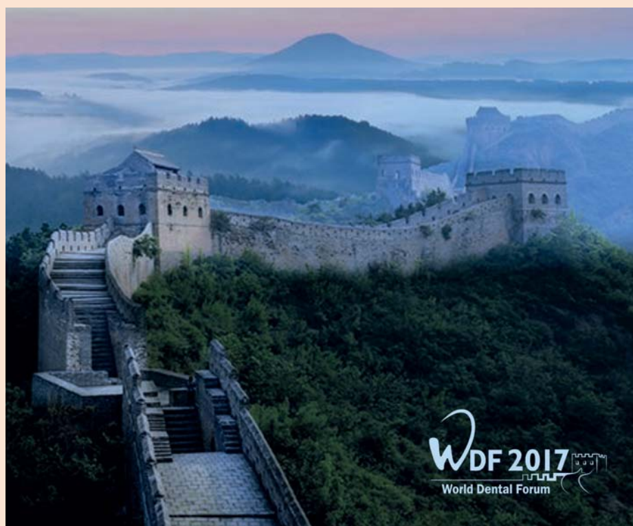
WORLD DENTAL FORUM 2017 du 28 octobre au 5 novembre 2017

Au départ, il y a une implication réelle de l'équipe dans la satisfaction du client. Alors, même si les exigences étaient nombreuses, variées et pas toujours simples à mettre en pratique, je crois que la perspective de travailler dans un environnement encore plus sûr était très motivante pour chacune et chacun d'entre nous. À l'arrivée, je vois qu'il y a beaucoup de fierté devant la reconnaissance de la qualité du travail fourni par chacun et surtout l'envie de progresser encore chaque jour.