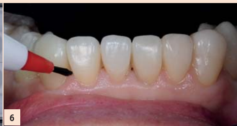
Fig. 6 : Les facettes sont essayées optiquement avec un try in paste, nettoyées, remises dans la boîte d'organisation, puis essayées esthétiquement et remises à leur place respective avant collage.