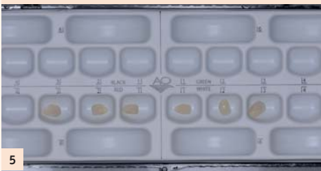
Fig. 5 : Les facettes arrivent maintenant du laboratoire : c'est le grand jour ! L'astuce consiste à placer toutes les pièces à essayer, à manipuler et à coller à 4 mains (et 2 cerveaux) dans une boîte de collage d'orthodontie (American Orthodontics®). Cette procédure permet d'éviter de mélanger les pièces à coller, de les perdre, de les endommager et de rester zen toute la séance et de partager le plaisir de coller avec son assistante et son patient !