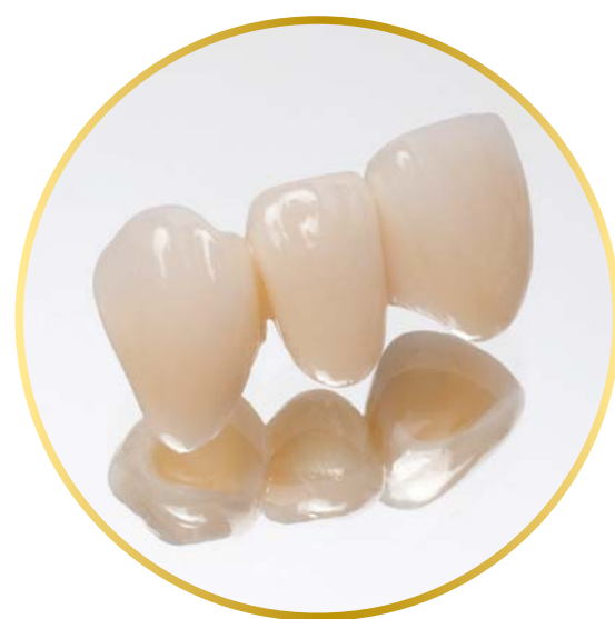
Céramique sur zirconium