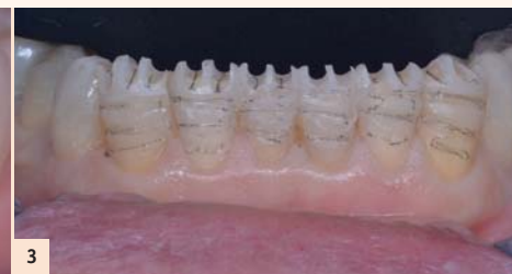
Fig. 3 : Préparations à travers les masques, favorisant l'économie tissulaire.