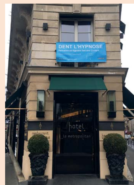
Formation avril 2017, Hôtel Le Metropolitan Paris

Comme celles de Lyon, les formations parisiennes en « 3 jours chrono » tiennent place dans un confortable hôtel 4* : Le Metropolitan. 4 praticiens expérimentés qui pratiquent l'Hypnose Clinique Ericksonienne au quotidien dans leur cabinet se sont unis pour vous transmettre leur savoir et partager leur expérience tout au long de l'année. Ce sont des formations aux 4 coins de la France et des supervisions gratuites ; des confrères bienveillants, à votre écoute, pour un enseignement accessible à tous et un suivi personnalisé ; un maximum de 20 participants par session pour un maximum de convivialité. Retrouvez Bruno, Christine, Joël et Marc dans un cadre adapté à une discipline qui vous assurera un exercice apaisé et des patients relaxés pour des traitements encore plus performants. Renseignements et inscriptions : dent-lhypnose.com & hypnodonte.fr