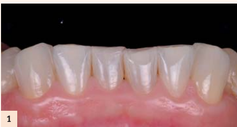
Fig. 1 : Lors de réhabilitations complexes, de nombreux éléments prothétiques en céramique, destinés à être collés, vont arriver du laboratoire. Il est alors possible qu'un moment d'inattention vienne perturber la séance de collage. Photo initiale d'un cas de réhabilitation globale esthétique et fonctionnelle de 28 éléments collés.