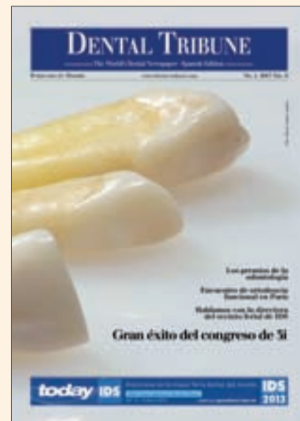
Portada del primer número de Dental Tribune Spain editado por Ripano.

Además, es la editorial de reconocidas organizaciones científicas internacionales como ALODYB (Asociación Latinoamericana de Operatoria Dental y Biomateriales), ALOP (Asociación Latinoamericana de Odontopediatría), SPO (Sociedad Peruana de Odontopediatría), AIO (Asociación Iberoamericana de Ortodontistas), IFUNA (International Functional