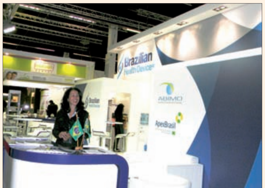
El área de recepción de ABIMO, la asociación de la industria médica y dental de Brasil.