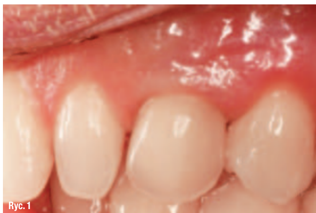
Ryc. 1 _ Implant okolicy 23 po 9 latach: zamiast recesji widoczny jest raczej nadmiar tkanek miękkich.