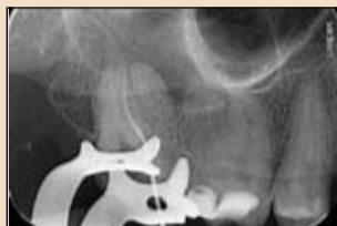
Εικ. 8. Ακτινογραφία του εργαλείου OneG στο δεύτερο εγγύς παρεϊακό ριζικό σωλήνα

διακλυσμοί στον πολφικό θάλαμο με υποχλωριώδες νάτριο (Εικ.3).