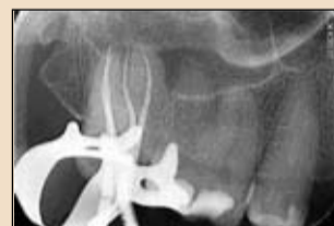
Εικ. 14. Ακτινογραφία με τον κύριο κώνο

σε διατομή διπλής έλικας 6.5χιλ. στο μυλικό τμήμα της ρίνης.