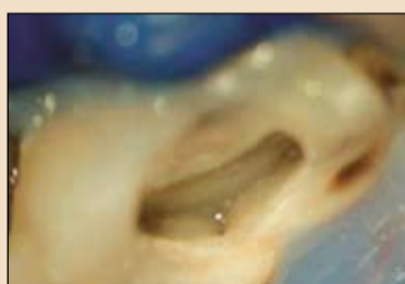
Εικ. 3. Διάνοξη του πολφικού θαλάμου