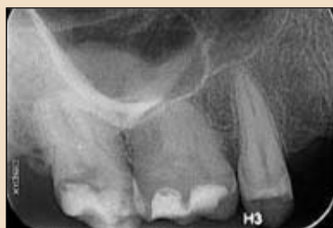
Εικ. 2. Αρχική ακτινογραφία του 17