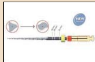
Εικ. 10. Το εργαλείο OneShape