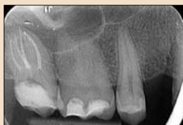
Εικ. 16. Τελική ακτινογραφία στον 17