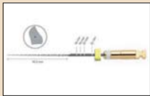
Εικ. 7. Το εργαλείο OneG