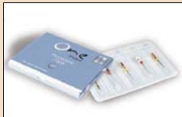
Εικ. 1. Το σύστημα ενδοδοντικών εργαλείων OneShape