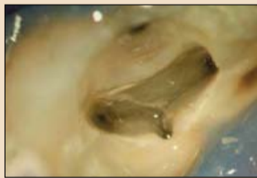
Εικ. 5. Μετά τη διέλευση του ENDOFLARE, ενθιάζεται η πρόσβαση στον άπω παρεϊακό ριζικό σωλήνα