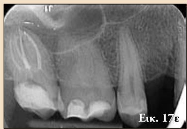
Εικ. 17. Αρχική ακτινογραφία - α) Ακτινογραφία του εργαλείου OneG στο δεύτερο εγγύς παρειακό ριζικό σωλήνα - β) Ακτινογραφία του εργαλείου OneShape στο δεύτερο εγγύς παρειακό ριζικό σωλήνα γ) Ακτινογραφία με τον κύριο κώνο - δ) Τελική ακτινογραφία

καλύτερη κεντρική λειτουργία, υψηλότερη αντοχή σε περιστροφικούς περιορισμούς και καλύτερη δυνατότητα επεξεργασίας κεκαμμένων ριζικών σωλήνων. Το άκρο του εργαλείου είναι παθητικό και επιτρέπει την ομαλή