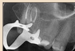
Εικ. 11. Διέλευση του OneShape στα δύο τρίτα του ME, 3χιλ. Πριν από το ME και στο ME