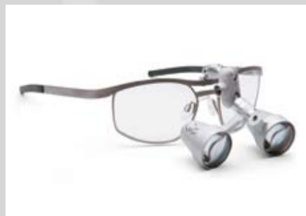
SV-UP 3,0- Titan Ti22