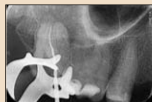
Εικ. 12. Ακτινογραφία του εργαλείου OneShape στο δεύτερο εγγύς παρεϊακό ριζικό σωλήνα