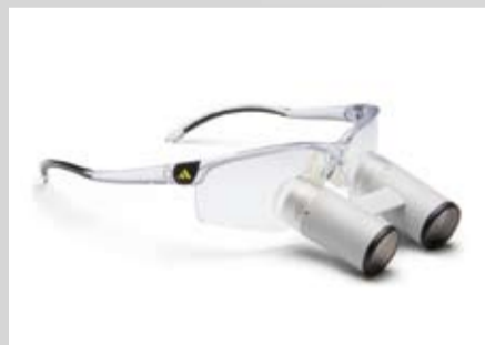
K-bino 4,2-10,0 Adizero