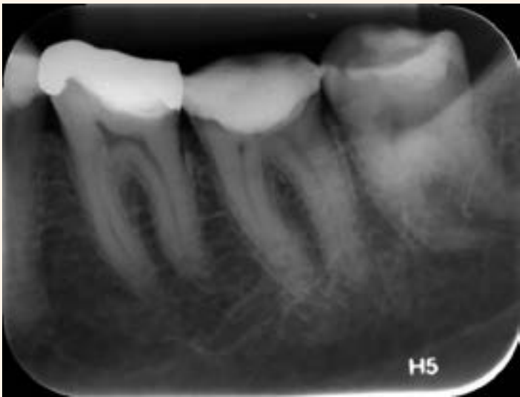
Imagen 1. Radiografía inicial.