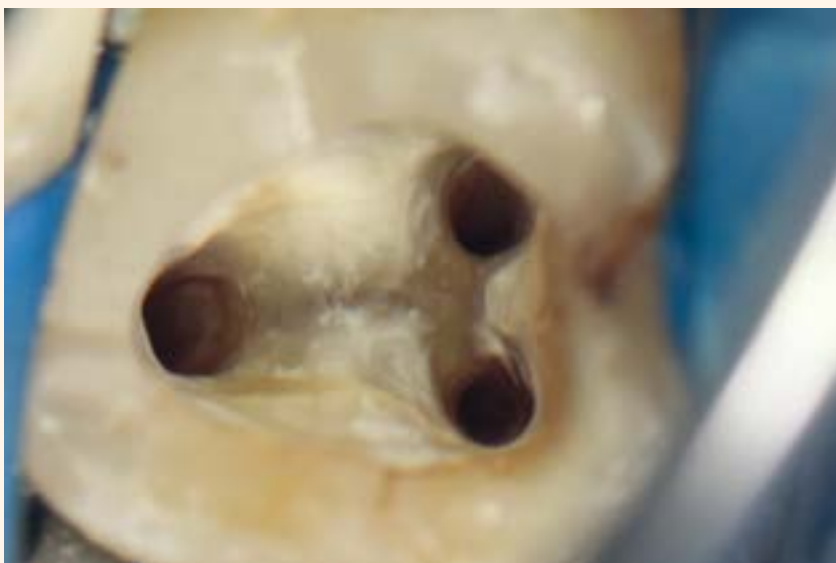
Imagen 5. Canales modelados y desinfectados.