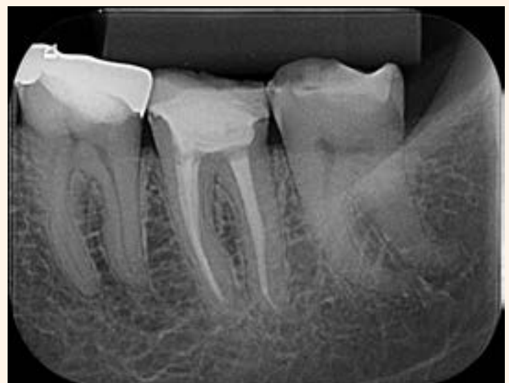
Imagen 8. Control Radiográfico después de 17 meses.