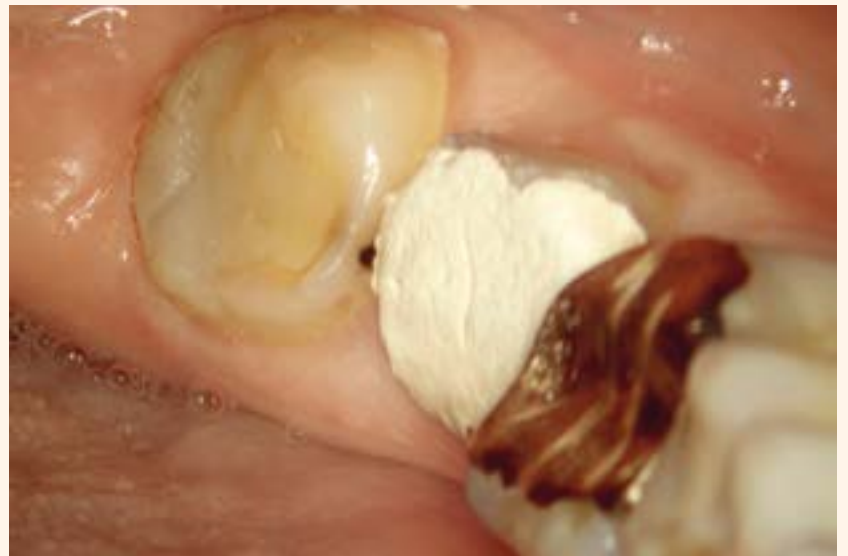
Imagen 2. Condición clínica inicial.