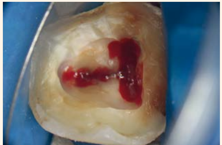
Imagen 4. Acceso a la cavidad pulpar y localización de los canales.