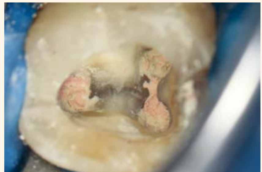
Imagen 6. Canales obturados con Guta Percha y MTA Fillapex.