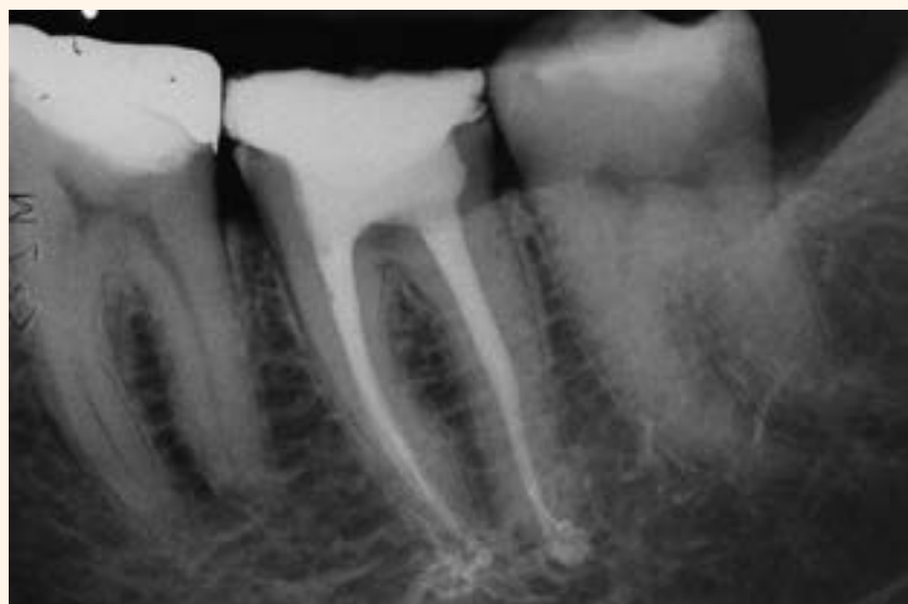
Imagen 7. Radiografía Final.