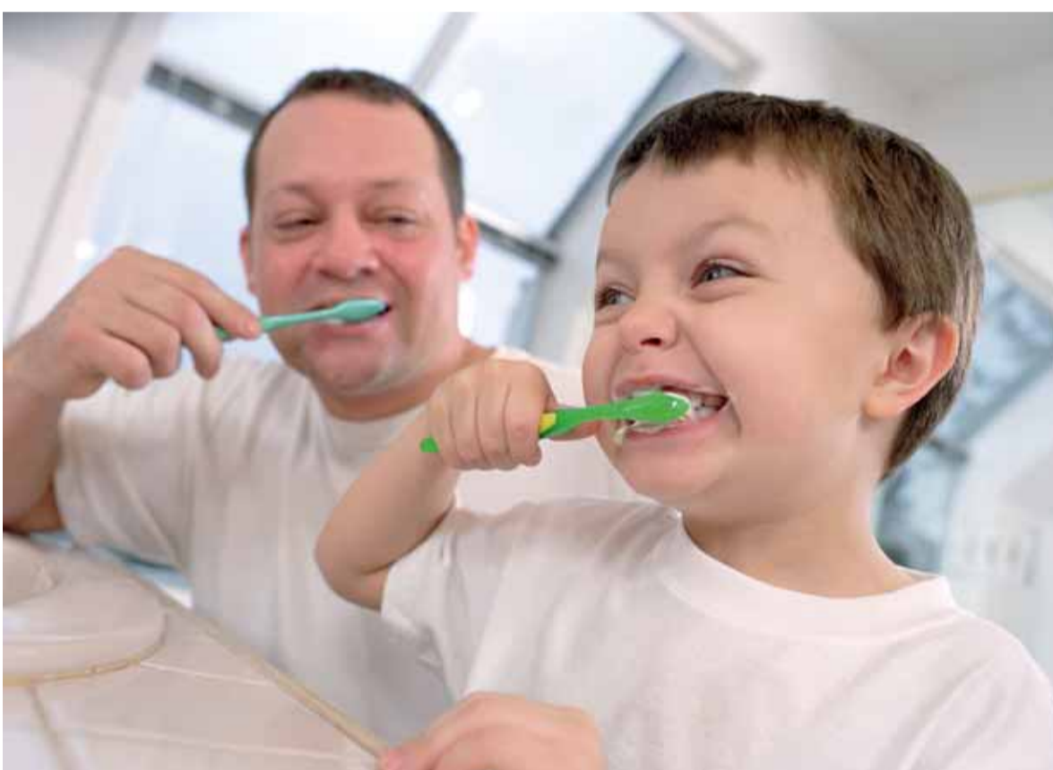
Het poetsgedrag van kinderen (en het toezicht daarop door de ouders) is vaak voor verbetering vatbaar.