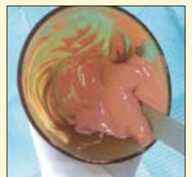
图5: 调拌海琴藻酸盐印模材。