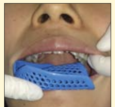
图3: 选择合适的托盘。