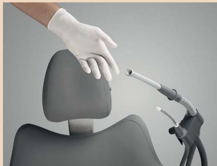
Alle XO 4-Einheiten enthalten serienmäßig den Saugschlauchhalter mit automatischer Rückholfunktion.

Wie hebt sich XO CARE vom Wettbewerb ab? Wir sind einfach anders als andere Hersteller und wollen das auch zeigen. Unsere XO-Einheit ist für jeden Behandler da – egal, ob Einzelarbeitsplatz oder Teamarbeitsplatz, ob große oder kleine, traditionsverhaftete oder visionäre Praxis. XO CARE vermittelt seit Jahren dieselben Werte: Ergonomie, Schwingbügel, Vierhandtechnik, Liegendpositionierung. Wir glauben, dass diese Werte der Schlüssel zu einer gesünderen Arbeitsweise und einer höheren Patientenzufriedenheit sind. Dank intuitiver Bedienung muss sich der Behandler nicht mehr auf sein Equipment konzentrieren, sondern kann dem Patienten seine volle Aufmerksamkeit schenken. Mit dem Prinzip der ERGONOMIC DENTISTRY stellen wir die Gesundheit des Behandlers an oberste Stelle. Wir möchten sicherstellen,