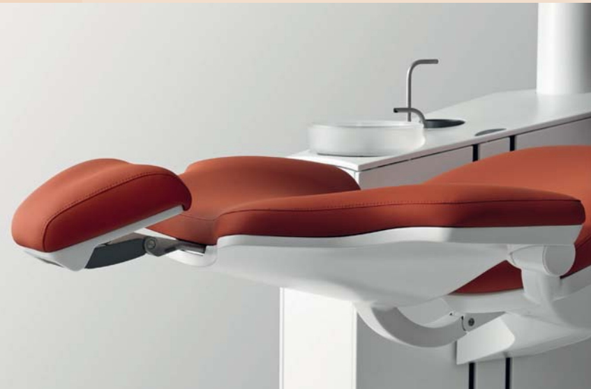
XO 4-Behandlungseinheiten von XO CARE garantieren Ergonomie und Gesundheit für Zahnarzt und Patient.