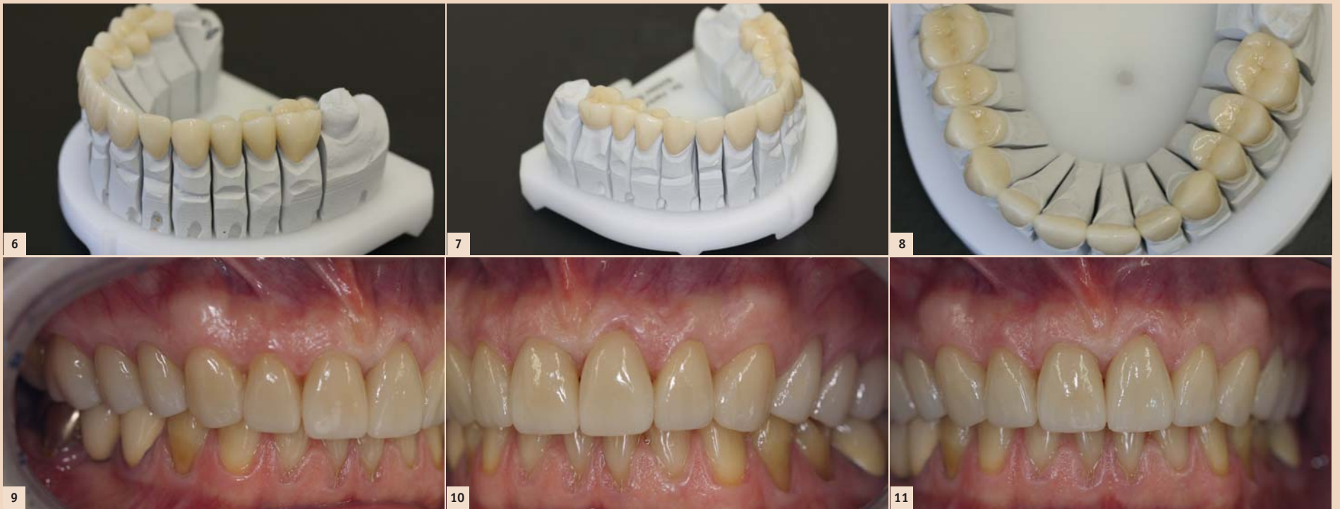
Abb. 6–8: Darstellung der Veneers, Teilkronen und Kronen auf dem Sägeschnittmodell. Die Kronen werden alle mittels Mikroskop auf ihren Randschluss hin geprüft und nur dann eingesetzt, wenn keine Frakturen oder Haarrisse zu erkennen sind. Die Qualitätskontrolle muss zwingend vor dem Einsetzen durch den Zahnarzt erfolgen und mögliche Problemstellen sollten festgehalten werden. – Abb. 9–11: Darstellung des Zahnersatzes in situ. Nach Einstellung der Okklusion wird abschließend das ästhetische Ergebnis mit der Patientin genau besprochen und akribisch dokumentiert. Ziel ist es, dass die Patientin sich insgesamt attraktiver findet, die Zähne aber nicht den Mittelpunkt des Gesichts einnehmen, wie es beispielsweise bei vielem Zahnersatz der Rubrik „A1“ aussieht. Der Patient kann vor der Herstellungs der Kronen nur geringfügig zur Farbbestimmung beitragen, denn immer besteht der Wunsch nach „weißen Zähnen“. Der ästhetisch versierte Behandler muss anhand des Alters, der Hautfarbe, des Stils und diverser weiterer Faktoren erkennen, welche Farbe dem Patienten „stehen“ wird. In diesem Fall ist die Farbgestaltung sehr gut gelungen.

ten der einzusetzenden Werkstoffe ebenfalls zu dem Behandlungsfall passen, denn die Keramiken unterscheiden sich deutlich in Bezug auf Transluzenz, Fluoreszenz und Opaleszenz. So müssen bei dunkel eingefärbten Dentinstümpfen oder Stümpfen mit Stiftaufbauten andere Keramiken eingesetzt werden, als dies bei minimalinvasiven Präparationen von einzelnen oberflächlichen Schmelzarealen der Fall ist. In der Frontzahnästhetik machen sich Presskeramikronen aus Lithiumdisilikat oder Glaskeramik besonders gut, denn die Translu-