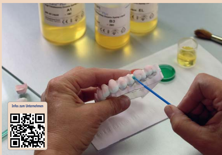
Anwendung der Lava Plus Färbeflüssigkeiten von 3M an einer monolithischen Versorgung aus Lava Plus Zirkoniumoxid.

3M hat in der Zahntechnik zahlreiche Lizenzen für seine Patente erteilt, darunter an die Firmen VITA Zahnfabrik H. Rauter GmbH &