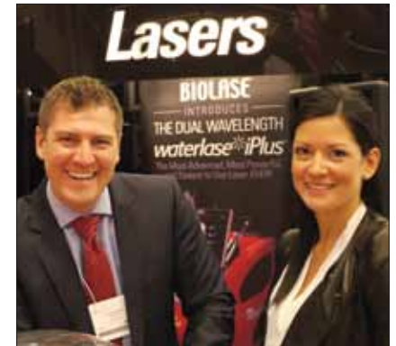
· Assurez-vous de faire l'essai des lasers au kiosque de Biolase (no. 200-202). · Be sure to try out the lasers in the Biolase booth (No. 200-202).