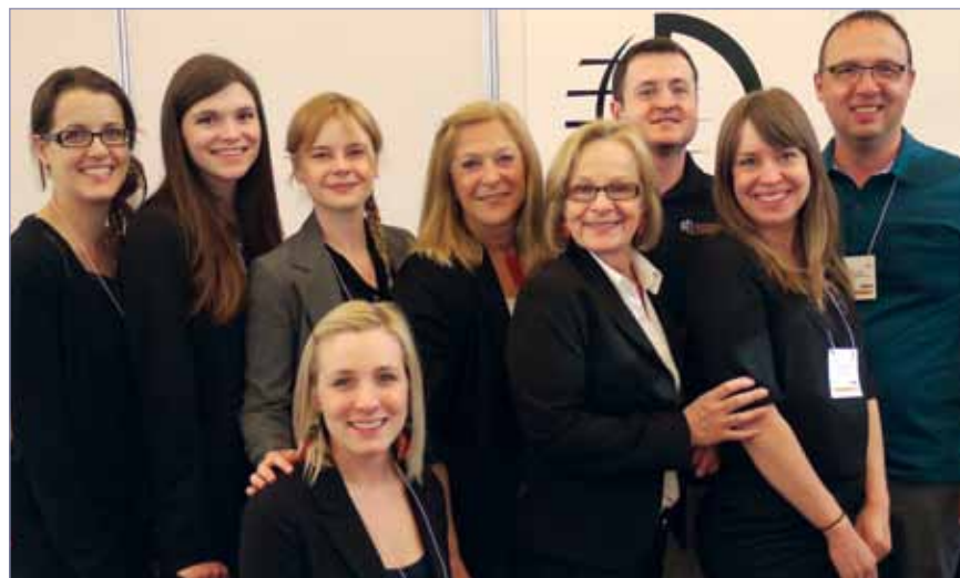
• Le personnel des inscriptions aux JDIQ, prêt à vous assister. (Photo/Anna Kataoka, Dental Tribune) • The JDIQ registration staff, ready to serve you. (Photo/Anna Kataoka, Dental Tribune)