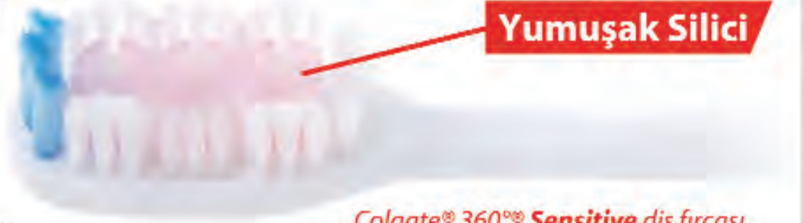
Colgate® 360® Sensitive diş fırçası

Dişlerin tüm yüzeylerini temizlemek için 2 dakika fırçalamanın yeterli olduğu söylenmektedir. Bu tıpkı çok zevk aldığınız bir yemekten sonra en sevdiğiniz müziği dinlemek gibidir. Hiç şüphesiz, daha sağlıklı bir gülüş için yemek sonrasında yapılan bir kişisel hijyen uygulaması ve aynı zamanda potansiyel bir problem olan dentin hassasiyetini de süpürme işlemidir.