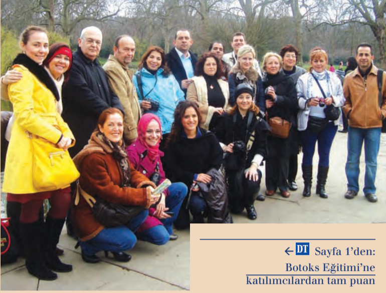
← DT Sayfa 1'den: Botoks Eğitimi'ne katılımcılardan tam puan

İhmcıları 23 Mart Salı sabahı İstanbul Atatürk Havalimanı'ndan kalkan uçakla Londra'ya hareket etti. Grup dört saat süren yolculuğun ardından bu şehre ulaştı. İlk olarak kalacakları otele yerleştirilen dişhekimleri, ilerleyen saatlerde Londra'nın ünlü alışveriş merkezlerinden Oxford Street'e gezdiler.