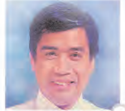
Dr. Arturo De Leon Fatma Diş Hekimliği Fakültesi Dekanı Filipinler

Dişleri doğru tekniklerle, günde en az 2 kere florür içeren bir diş macunu ile fırçalamak, bireyin aside dirençli bir tabaka oluşturmasına yardımcı olur. Dentin hassasiyeti görülen durumlarda ise hassasiyet giderici diş macunlarının kullanılması ile rahatlama sağlanabilir. Uygun rahatlama aramaları sırasında yapılan bilimsel çalışmalar dentin hassasiyetinin giderilmesinde özellikle daha doğal yolların ve doğal içeriklerin kullanılmasına yöneliktir. ( örneğin dentin tübüllerinin kalsiyum ve fosfat açısından zengin maddelerle kapatılması )