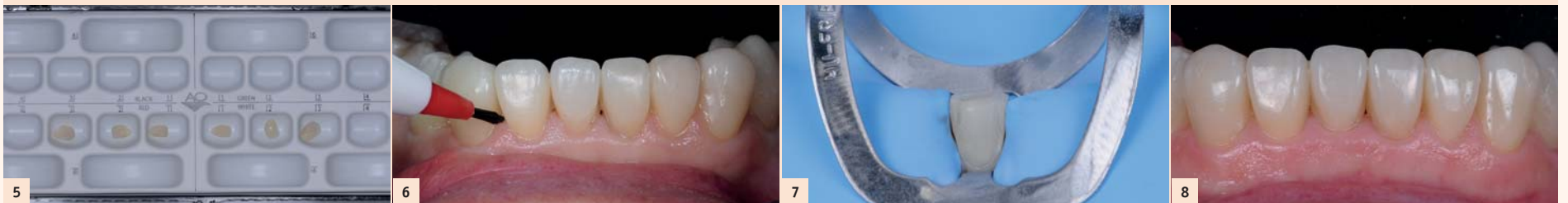
Fig. 5 : Les facettes arrivent maintenant du laboratoire : c'est le grand jour ! L'astuce consiste à placer toutes les pièces à essayer, à manipuler et à coller à 4 mains (et 2 cerveaux) dans une boîte de collage d'orthodontie (American Orthodontics®). Cette procédure permet d'éviter de mélanger les pièces à coller, de les perdre, de les endommager et de rester zen toute la séance et de partager le plaisir de coller avec son assistante et son patient !