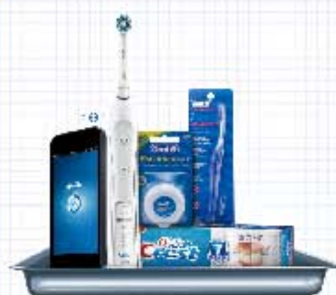
高端正畸护理计划