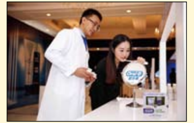
与会者现场体验欧乐B洁齿护龈家用双管套装

管套装，突破性地将深层清洁与后续修护的活性成分独立封存于两管中。使专业护龈成分可以释放更有效的活性因子，到达难刷部位，深层洁净；并能形成保护膜，实现1+1大于2的效果。