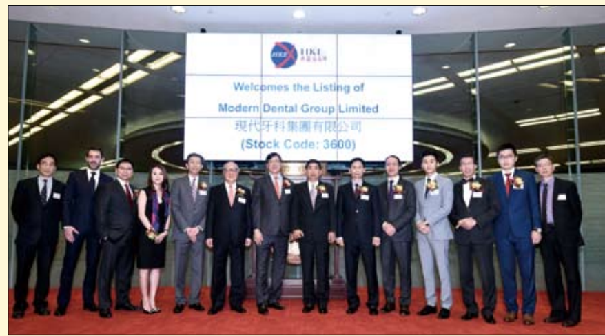
现代牙科集团在香港主板市场成功上市

为开拓中国内地市场，现代牙科集团于1998年投资成立了洋紫荆牙科器材(深圳)有限公司。2009年洋紫荆牙科器材(深圳)有限公司又投资成立了洋紫荆牙科器材(北京)有限公司，负责中国北方的市场。目前，洋紫荆已成为中国内地市场最大的义齿制作公司之一，在业界享有良好口碑，客户群遍及内地各大中城市，国内数十所知名大学