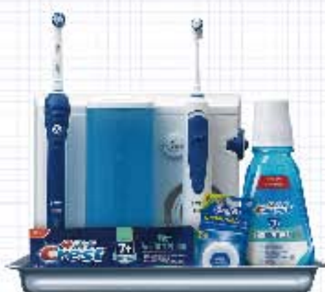
专业种植护理计划