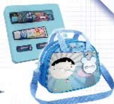
专业儿童护理计划