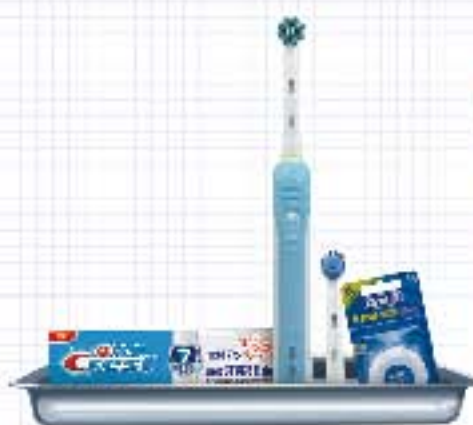
专业洁牙护理计划