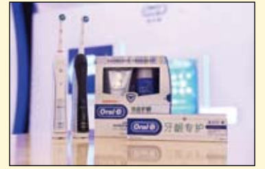
欧乐B洁齿护龈家用双管套装及牙龈专护系列

与欧乐B洁齿护龈家用双管套装同步上市的还有3款牙龈专护牙膏。通过全套护龈系列产品的推出，欧乐B将口腔专业护理成分与功效浓缩于家用，为万千中国消费者提供更全方位的家庭专业口腔护理体验。