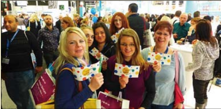
在2015年科隆国际牙科展 (IDS) 上, 世界牙科论坛 (DTI) 展示了全新设计的公司标识。

在刚刚过去的一年中, 世界牙科论坛 (DTI) 可谓是硕果累累。随着众多新的会展活动与牙科组织加入到世界牙科论坛 (DTI) 的合作伙伴关系, 公司旗下的出版物产品线也进一步得到扩充。在此, 世界牙科论坛 (DTI) 感谢全球读者与合作伙伴的大力支持。通过制定一系列新的项目与目标, 世界牙科论坛 (DTI) 期待在新的一年里取得更大成就。