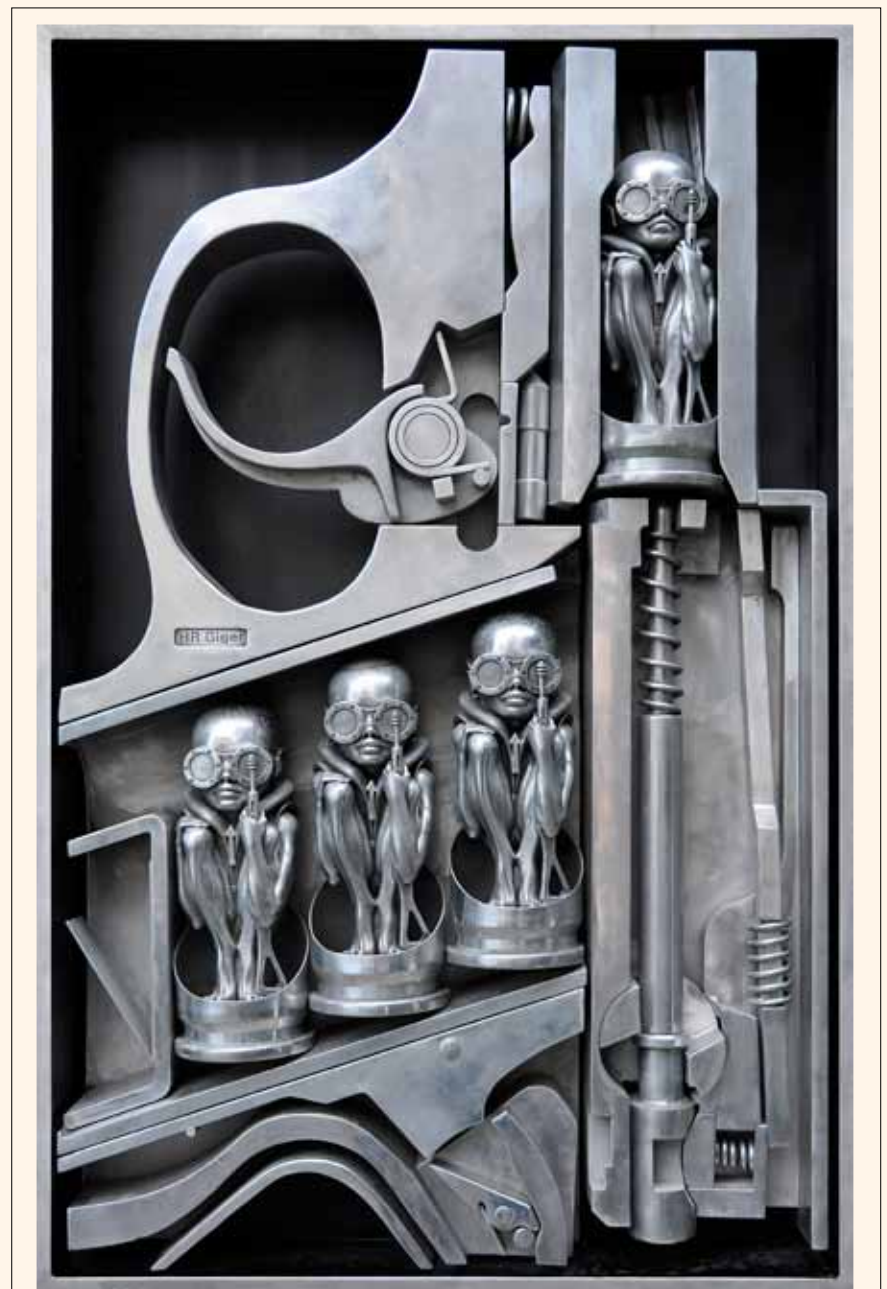
«Birth Machine», escultura metálica de dos metros que recibe a los visitantes al Museo H.R. Giger. Vea el reportaje en la página 28.

Con objeto de mejorar el componente psicológico de la estética que percibe el paciente, el artículo ti-