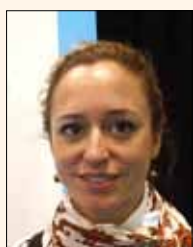
2. Vicerector Académico ISEO, Director del Máster de Cirugía, Periodoncia e Implantología de la Universidad de Alcalá de Henares de Madrid (España).