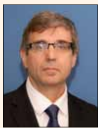
1. Profesora colaboradora en el Máster de Implantología, Periodoncia y Cirugía Bucal ISEO (Instituto Superior de Especialidades Odontológicas), Universidad de Alcalá de Henares de Madrid (España).

El primer artículo «Planificación y realización implantológica con CAD/CAM», describe los hallazgos tecnológicos y su aplicación clínica para mejorar tanto los métodos diagnósticos que hacen posible una