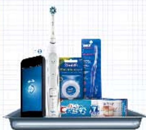
高端正畸护理计划