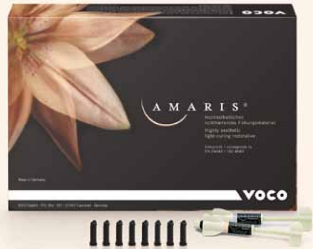
Restauración de los dientes anteriores con Amaris