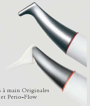
> Pièces à main Originales Air-Flow et Perio-Flow

La méthode Originale Air-Flow Perio consiste à éliminer le film bactérien nocif jusqu'au fond des poches les plus profondes. La réduction des bactéries sous-gingivales prévient la perte des dents (parodontite) ou le détachement des implants (péri-implantite). Le tourbillon uniforme du mélange air-poudre et eau prévient l'emphysème des tissus mous – même lorsque l'on va au-delà des limites de la prophylaxie – grâce à l'action de l'embout Perio-Flow.