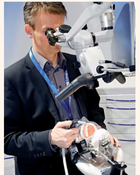
Surgical microscopes allow minimally invasive endodontic treatment.

Des progrès technologiques ont également été réalisés dans d'autres domaines de l'endodontie. La longueur de travail est déterminée soit au moyen de rayons X ou avec l'aide des méthodes modernes de mesures électroniques, celles-ci ne provoquant pas d'exposition supplémentaire aux radiations. Des préparations chimiques efficaces, dont l'action peut être renforcée par des méthodes ultrasonores ou hydrodynamiques, sont utilisées pour l'irrigation du canal radiculaire qui aide souvent au succès de la procédure.