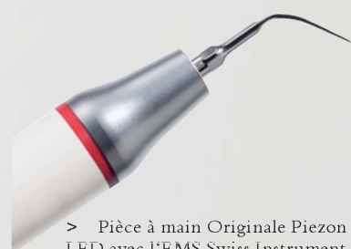
> Pièce à main Originale Piezon LED avec l'EMS Swiss Instrument PS

Traitement pratiquement indolore pour le patient et particulièrement doux pour l'épithélium gingival: un maximum de confort pour le patient, tel est l'argument décisif de la Méthode Originale ultramoderne Piezon. Sans parler des surfaces dentaires exceptionnellement lisses qu'apporte le traitement. Ces bénéfices supplémentaires sont le résultat d'oscillations linéaires à la surface dentaire, délivrées par les EMS Swiss Instruments