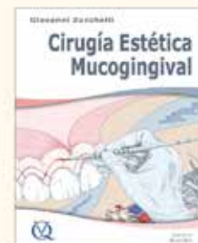
Cirugía Estética Mucogingival Autor: Dr. Giovanni Zucchelli 826 páginas en 2 volúmenes Encuadernación de lujo P.V.P. 300 €