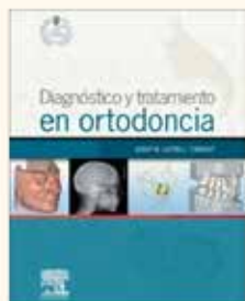
Diagnóstico y tratamiento en ortodoncia Autor: Dr. Josep M o Ustrell Torrent 592 páginas Encuadernación rústica P.V.P. 80 €