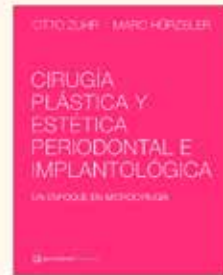
Cirugía Plástica y Estética Periodontal e Implantológica Autores: Dr. Otto Zuhrt y Dr. Marc Hürzeler 872 páginas Encuadernación de lujo P.V.P. 320 €