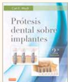
Prótesis dental sobre implantes Autor: Dr. Carl E. Misch 1008 páginas Encuadernación de lujo P.V.P. 168 €