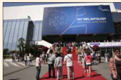
La Conferencia Global de MIS 2013, celebrada en Cannes.

• MIS Global Conference: www.mis-events.com/ Barcelona