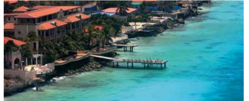
Bonaire kent veel villa's en luxe accommodatie, maar de leefomstandigheden van de inheemse bevolking wijken hiervan sterk af.

KRALENDIJK - Tandartsen op Bonaire zijn bezorgd over de bezuinigingsmaatregelen van minister Schippers van VWS voor de zorgverzekering van Caribisch Nederland, de BES. "Deze bezuinigingen zijn onverantwoord en zelfs ondemocratisch te noemen," aldus de Bonaire Dental Association (BDA).