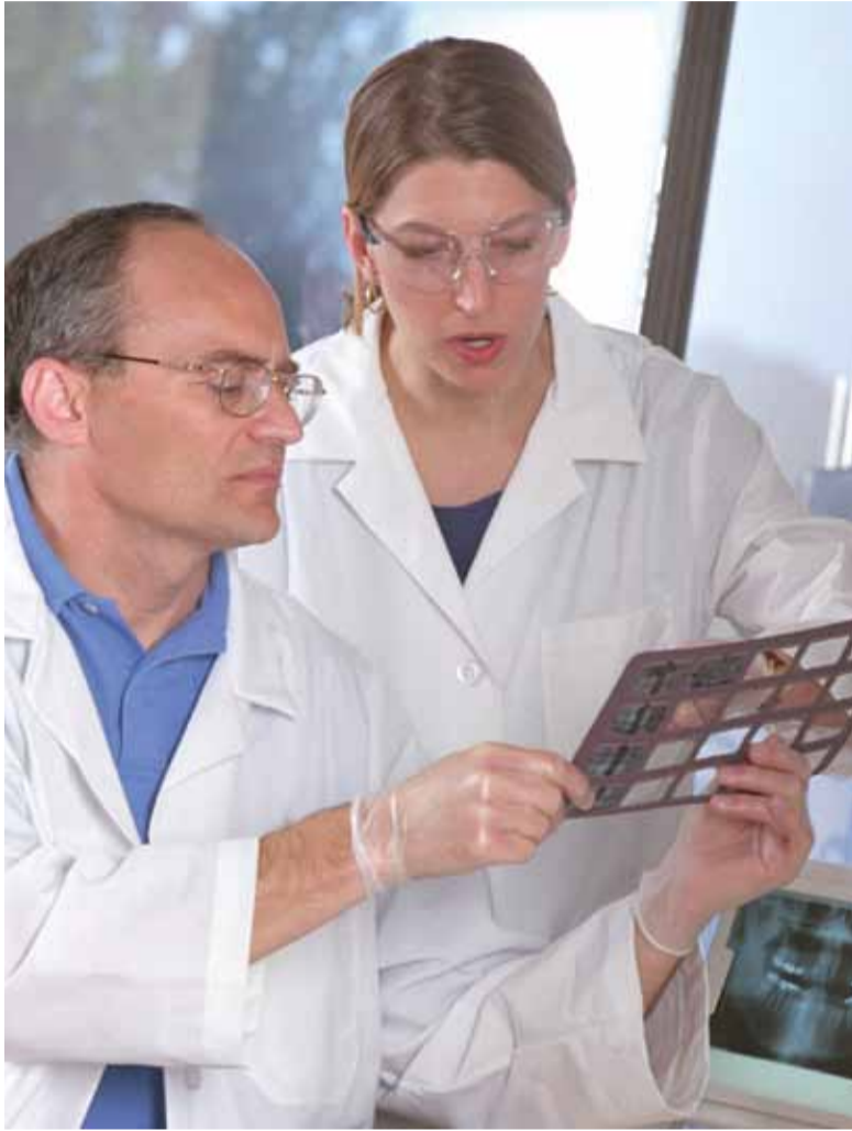
Elke medewerker heeft behoefte aan uitdagingen en een prettige werksfeer.