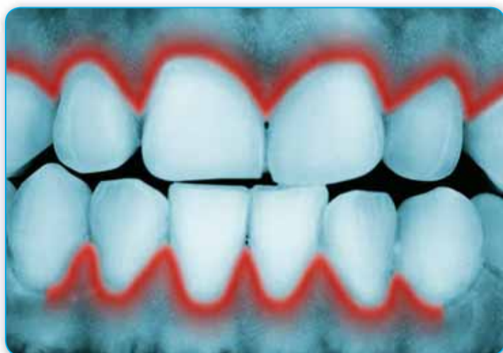
Vóór gebruik: Significante tandvleesproblemen

Digitale weergave van het gebied en de ernst van de tandvleesproblemen vóór en na gebruik 1