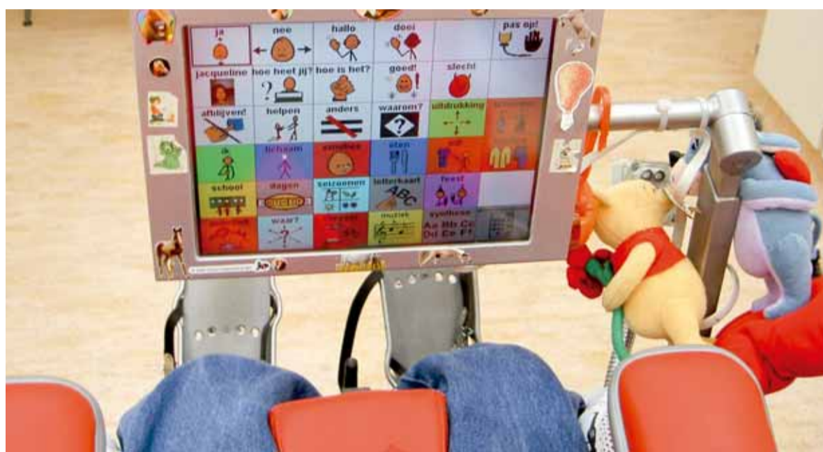
Patiënten met een lichamelijke of verstandelijke beperking hebben in veel gevallen 'een gebruiksaanwijzing'. Vaak heeft de behandelaar echter onvoldoende kennis over deze problematiek.