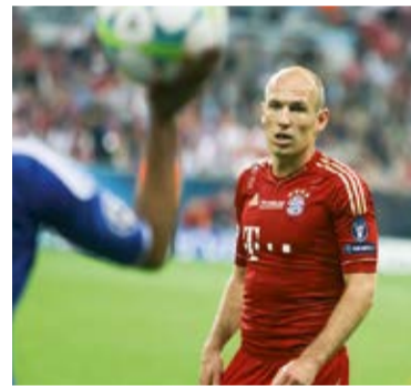
Robben is bezig aan zijn tiende seizoen voor Bayern München.

Volgens Bild zijn ontstekingen in de mond, die het immuunsysteem