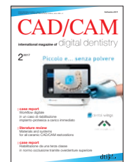
Immagine di copertina cortesemente concessa da cmf marelli srl, www.cmf.it