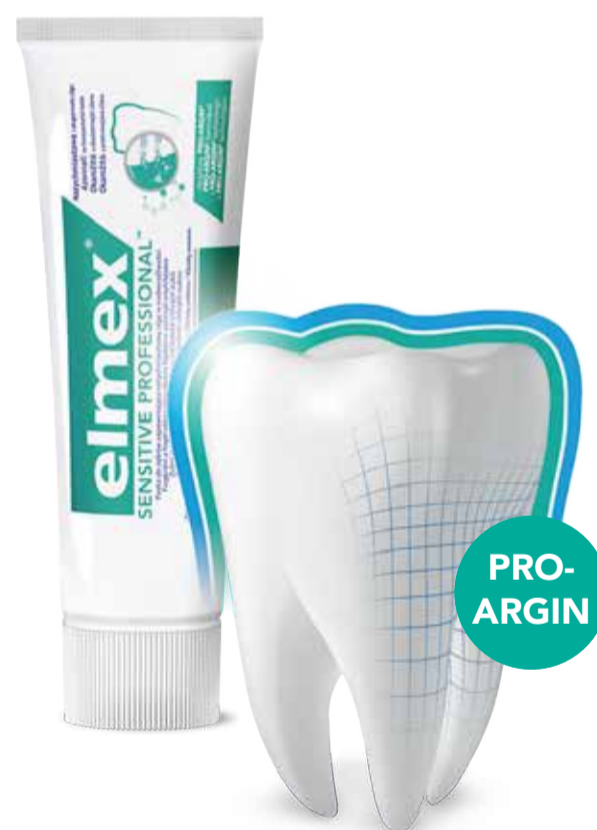
elmex® Sensitive Professional със своята уникална технология Pro-Argin