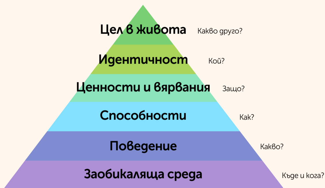
Фиг. 1 Пирамидата на Dilts на логическите нива на промяната.

да проведа два до три уебинара или коучинг сесии, често с хора от различни държави или континенти. Ако всичко това трябваше да се случи на живо, никога нямаше да успея да комуникирам с толкова много хора в рамките на същия времеви интервал.