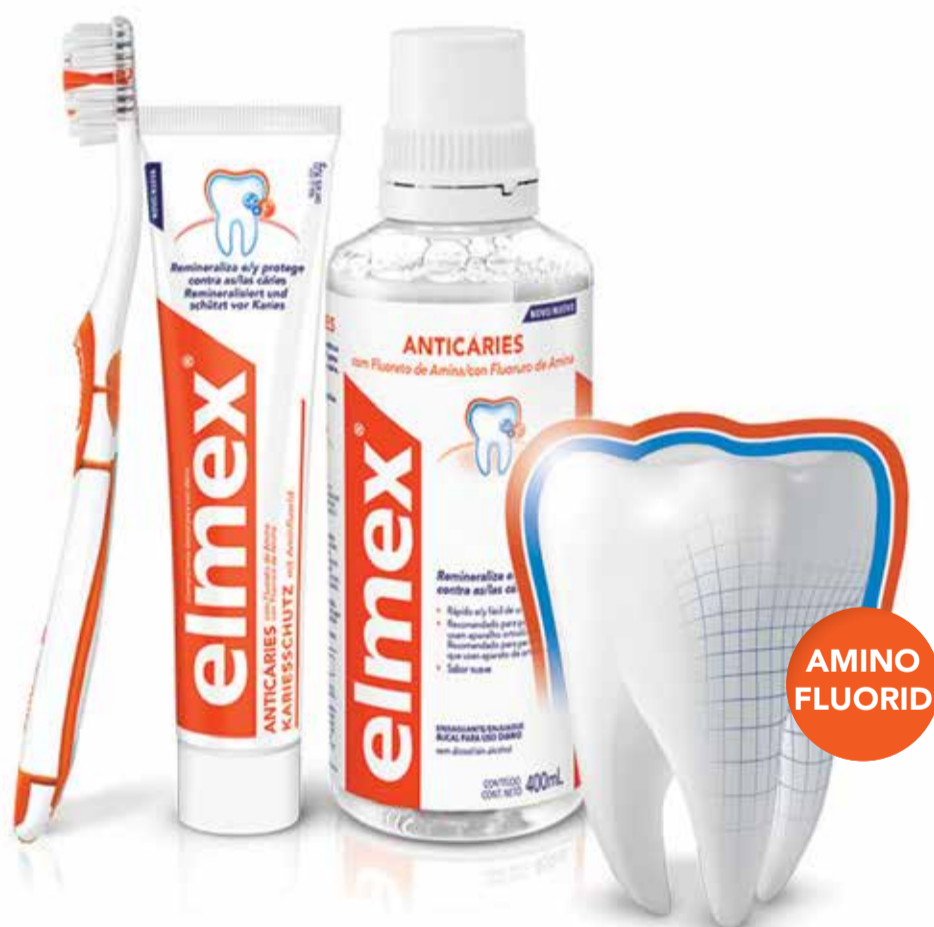
elmex® Caries Protection с аминоксид технология