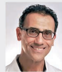
George K. Merijohn Periodontics