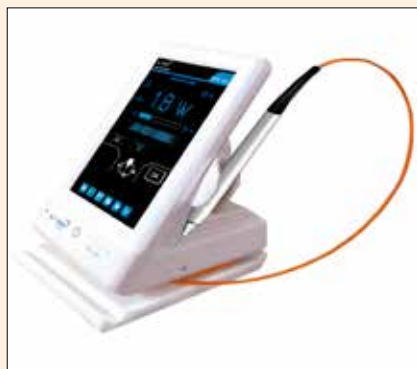
La versatilidad del láser Goliat hace que sea como tener tres equipos en uno.

Goliat, que es un equipo fácil y amigable de utilizar, sigue el mismo concepto formativo, brindando el material necesario para que el profesional pueda investigar más sobre todo el potencial terapéutico y quirúrgico que ofrece el láser.