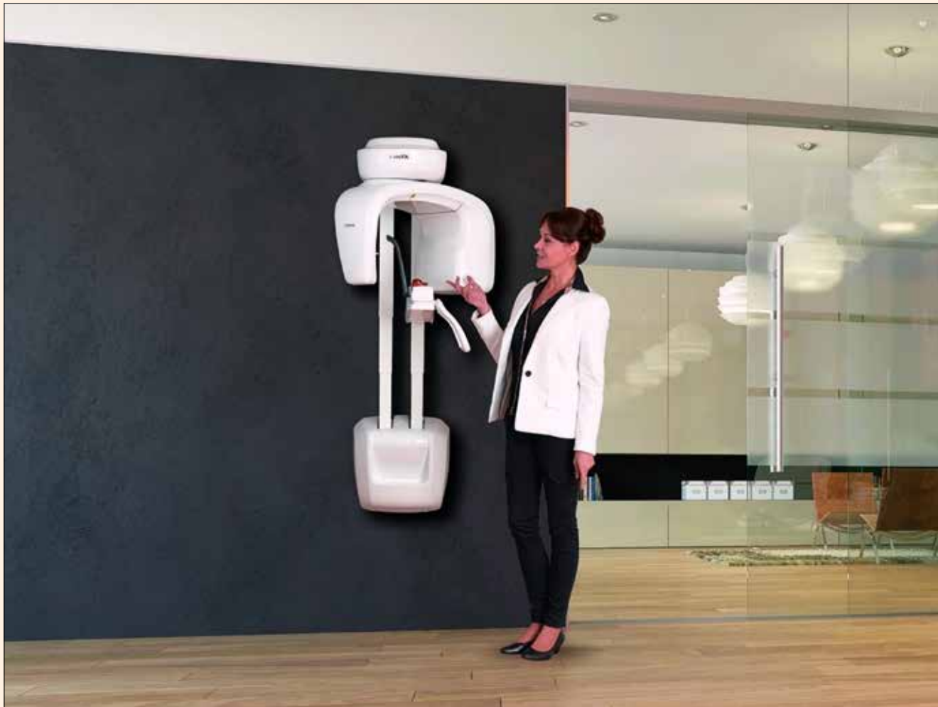
El I-Max 3D de Owandy es versátil y no ocupa casi espacio.