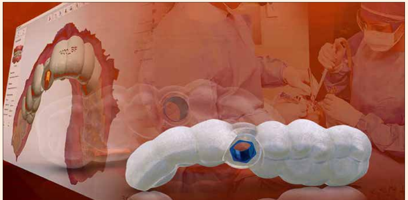
Ejemplo del nuevo servicio de Glidewell Laboratories de planificación digital del tratamiento.

La información publicada por Dental Tribune International intenta ser lo más exacta posible. Sin embargo, la editorial no es responsable por las afirmaciones de los fabricantes, nombres de productos, declaraciones de los anunciantes, ni errores tipográficos. Las opiniones expresadas por los colaboradores no reflejan necesariamente las de Dental Tribune International. ©2019 Dental Tribune International. All rights reserved.