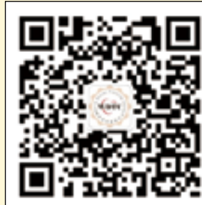
世界牙科论坛微信公众账号