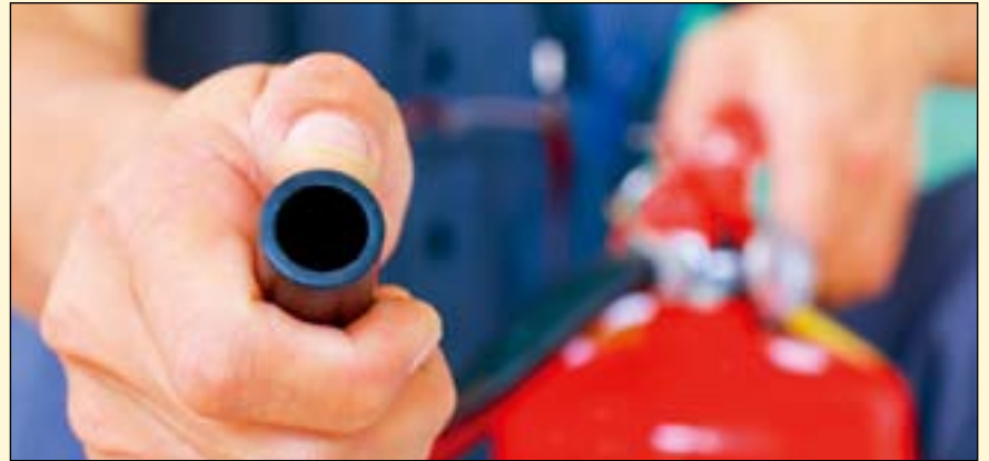
预防火灾远比从火灾中恢复要容易的多。

的员工和患者的安全。值得庆幸的是，完全符合规定并不像预期的那么困难，但如果不是这样的话，就有可能被判处巨额罚款甚至被判刑。