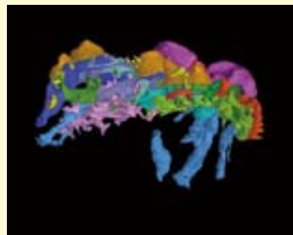
对Lophosteus颌骨的同步辐射成像为口腔组织学提供了有价值的思考。