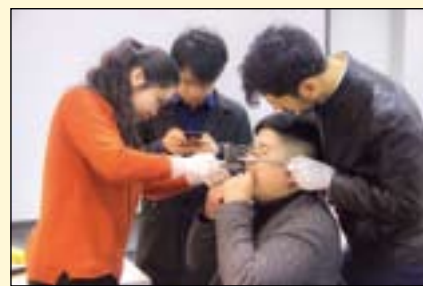
学员两两分组配对进行实操，使用殆架。