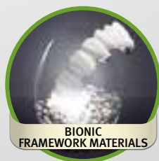
BIONIC FRAMEWORK MATERIALS