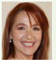
Por Helga Mediavilla Ibáñez