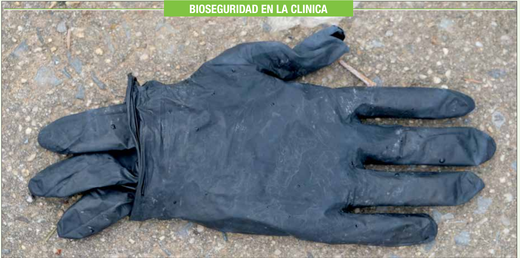
Uno de los artículos más buscados al inicio de la pandemia, tirado en una calle de Nueva York.