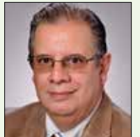
Por José Agustín Zerón

El síndrome respiratorio agudo severo (SARS) y la replicación de coronavirus está regulada por una diversidad de factores del huésped e induce alteraciones drásticas en la fisiología y daño en la es-