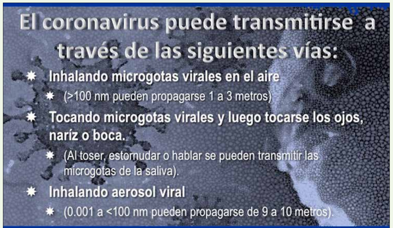
Las microgotas son la vía principal de transmisión del SARS-CoV-2, el virus que provoca la enfermedad Covid-19.

La Guía para el Diagnóstico y el Tratamiento de Covid-19 (5ª edición) publicada por la Comisión Nacional de Salud de la República Popular de China, afirma que la clorhexidina que se usa comúnmente como enjuague bucal no es efectiva para matar al coronavirus. Dado que el SARS-CoV-2 es vulnerable a la oxidación, se recomienda usar un enjuague bucal preprocedimiento que contenga agentes oxidantes (peróxido de hidrógeno al 1% o yodopovidona al 0.2%), con el fin de reducir la carga salival de los microbios orales, incluido el coronavirus. Necesitamos tomar muy en serio el papel que tenemos para ayudar a mi-