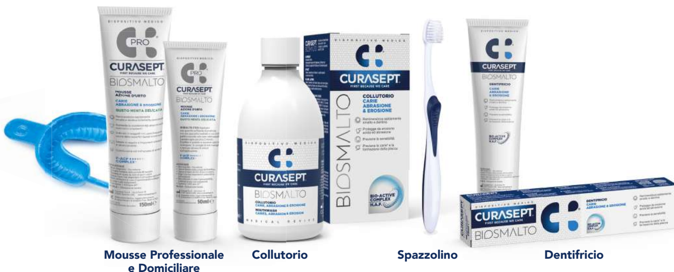
Mousse Professionale e Domiciliare

AUTORI: Ionescu Ac., Izzo D., Pulcini MG., Dian A., Brambilla E. Università degli Studi di Milano, Laboratorio di Microbiologia Orale e Biomateriali. IRCCS Istituto Ortopedico Galeazzi, Clinica Odontoiatrica. Collegio dei Docenti, Napoli. 2019. Codice Poster MAT05. Journal of Osseointegration 2019