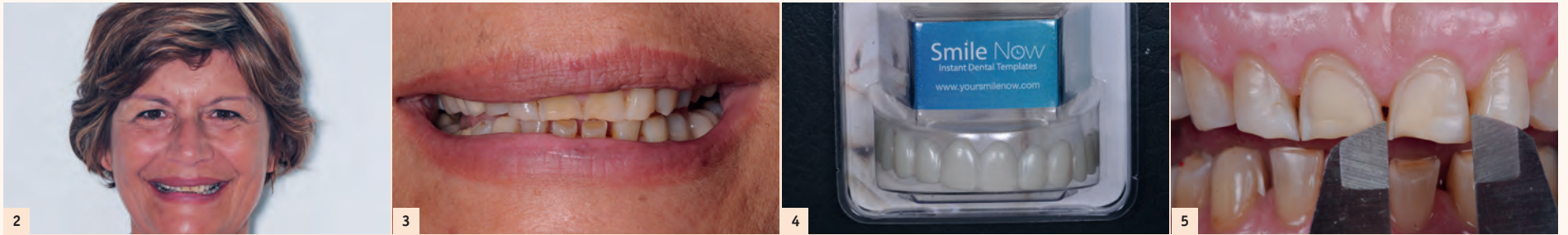
Fig. 1 : M me JC se présente à la consultation désireuse d'une solution esthétique pour son sourire qu'elle trouve vieillissant.