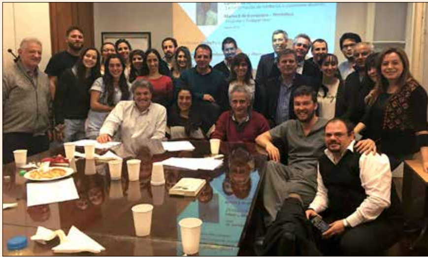
Los organizadores de las jornadas internacionales tras una sesión.