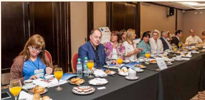
Un grupo de trabajo durante una reunión para determinar temas.