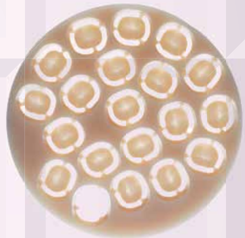
98mm x 14mm