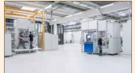
La planta de fabricación del circonio de Amann Girrbach en Austria.

Para un mecanizado perfecto mediante CAD/CAM y la garantía de unos resultados altamente estéticos, Amann Girrbach no solo cumple con los requisitos regulados normativamente durante la fabricación de las piezas en bloque (como la biocompatibilidad y la resistencia), sino que, además, tiene en cuenta otros muchos factores que influyen decisivamente sobre la calidad. Además del uso de materias primas de máxima calidad, se tienen también en cuenta aspectos del procesamiento como la estabilidad de los bordes y el sinterizado, la aptitud para el fresado y el comportamiento de abrasión ante las herramientas de fresado. Las propiedades estéticas se reflejan en el color y la translucidez. La suma de todos los parámetros mecánicos, biológicos, de procesamiento y estéticos que integran el proceso de desarrollo conforman el Zolid DNA. Y su complemento perfecto se encuentra en los componentes de software y de hardware del sistema CAD/CAM de Ceramill. Gracias a la combinación armoniosamente equilibrada de material, módulos CAD