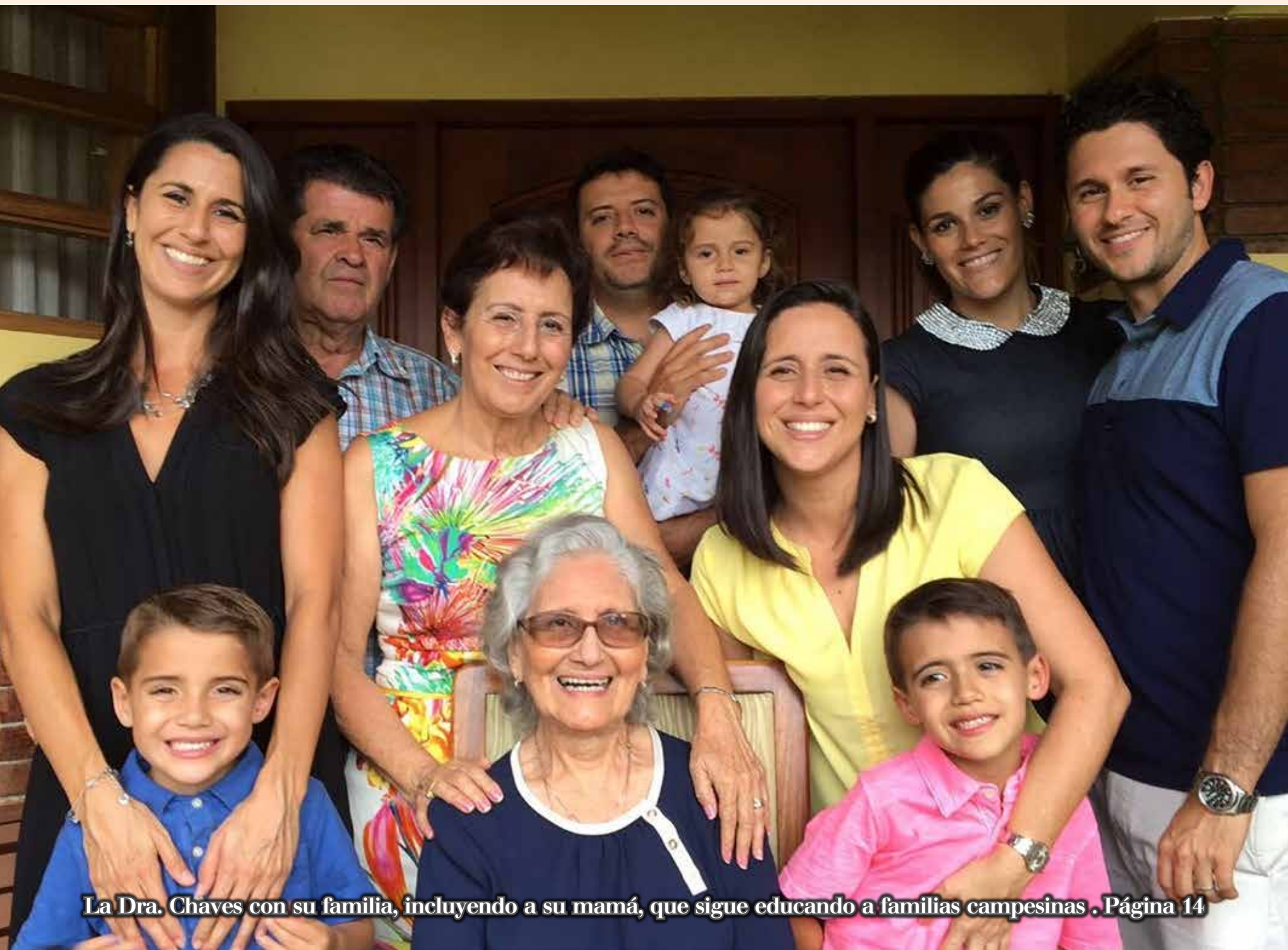
La Dra. Chaves con su familia, incluyendo a su mamá, que sigue educando a familias campesinas . Página 14