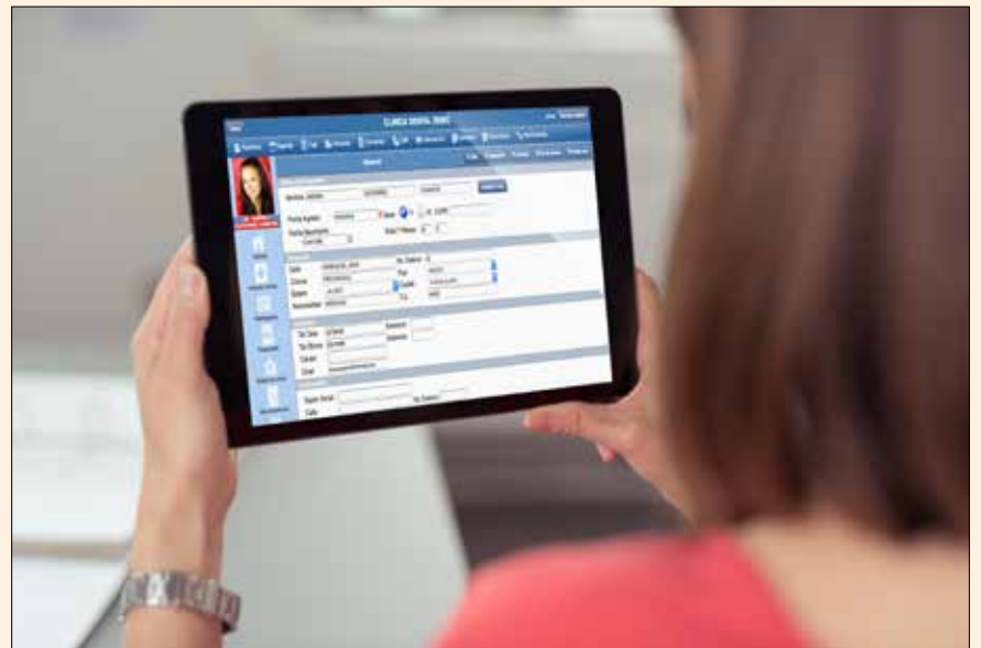
La ficha clínica de una paciente en el sistema Dentis365.

El programa tiene todas las funciones que se requieren para llevar un eficiente control de sus pacientes y la administración de su clínica, lo cual incluye: