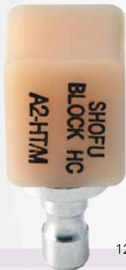
12mm x 14mm x 18mm