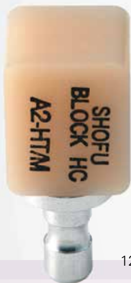
12mm x 14mm x 18mm