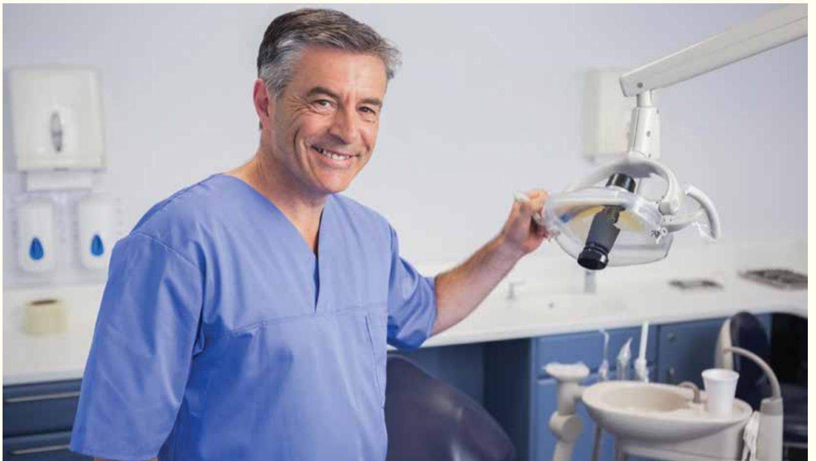
Izveštaj o profesijama u SAD-u otkriva da poslovi u oblasti brige o oralnom zdravlju nude veću platu i nižu stopu nezaposlenosti.

Profesija ortodonta se našla na 11. mjestu na listi 100 najboljih poslova, te vidimo da je bila vrlo blizu da se nađe u top 10 najboljih poslova. Najbolja tri posla su liječnik pomoćnik, softver developer te medicinska sestra.