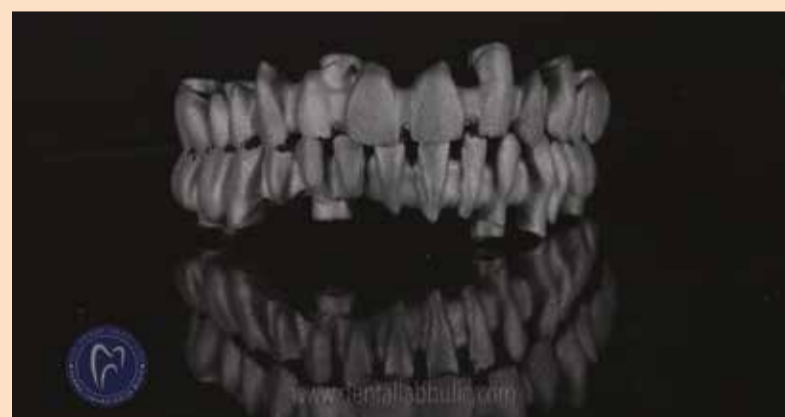
Slika 3: Printani metal u 3D printing centru DDS, za zubnu laboratoriju Bulić.

ruške stentove (surgical guides); privremene krunice; prototip mosta ili konstrukcije itd. (Slika 2).