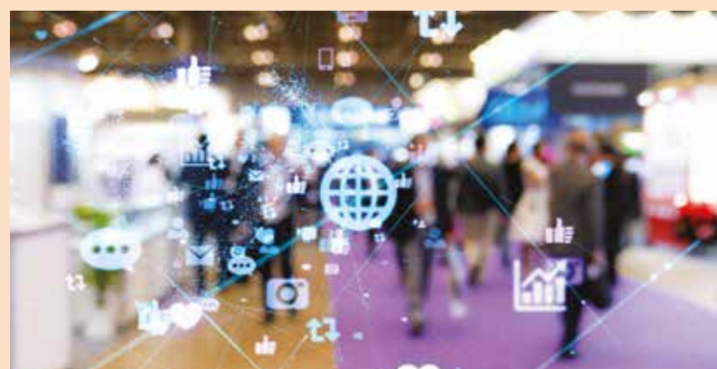
Organizatori IDS-a osnovali su hibridnu radnu grupu za primenu brojnih digitalnih alata za sajam 2021. godine.

KELN, Nemačka: Otprilike šest meseci pre događaja, organizatori Internacionalnog dentalnog sajma (IDS) najavili su da će primeniti nekoliko digitalnih elemenata za 39. IDS, koji će se održati sledeće, 2021. godine. U svetlu postojećih ograničenja putovanja, ova digitalizacija ima za cilj da olakša pristup svetskom sajmu posetiocima iz inostranstva koji neće moći uživo da prisustvuju. Digitalna IDS platforma će pružiti informacije o novim proizvodima, live streaming webinaru, konferencija za štampu i drugih događaja uživo, kao i komunikaciju „jedan na jedan“.