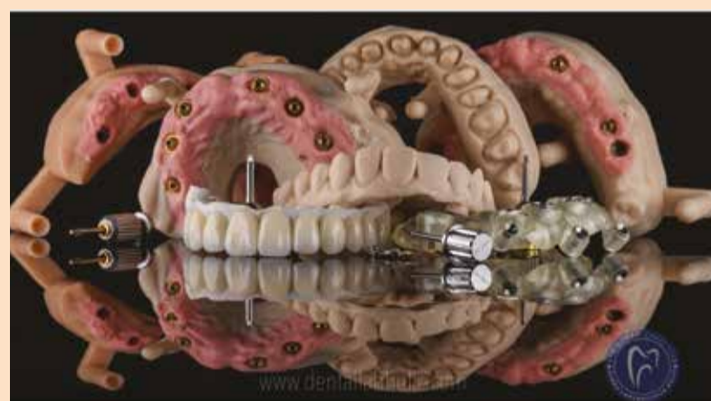
Slika 2: 3D štampani modeli, hiruški stentovi, prototipovi mosta itd.

Štampano gotovo sve: master modele; modele antagonista; modele digitalno dizajniranog waxup-a; hi-