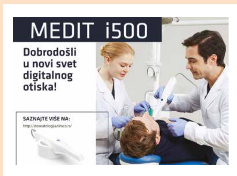
Slika 1a: Intraoralni skener.

„Promena, stalna promena, neizbežnost promene, to je dominantan faktor u današnjem društvu. Nijedna razumna odluka se ne može doneti, a da se ne uzme u obzir ne samo svet kakav jeste, nego i svet kakav će biti... To znači da naši državnici, naši privrednici, svaki naš čovek mora razmišljati na način „science fiction“.“ Isaac Asimov