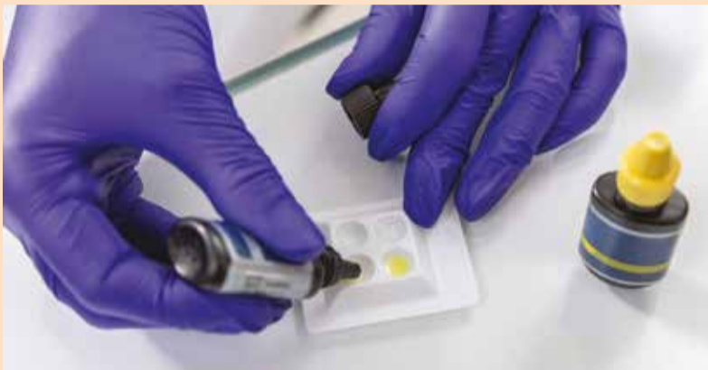
Istraživanje je imalo za cilj da istraži dubinu tubularne penetracije četiri različita materijala za punjenje kanala korena zuba koja se koriste sa dve različite metode obturacije u dentinu apikalnog, srednjeg i cervikalnog dela korena.

KIRIKKALE, Turska: Poznato je da neki mikroorganizmi mogu prodrati u dentinske tubule i ponekad čak i preživeti endodontska rešenja za efikasnu irigaciju. U ovoj fazi je upotreba sredstva za zatvaranje kanala korena zuba presudno važna za uklanjanje mikroorganizama unutar tubula kako bi se postigla efikasna antimikrobna aktivnost. Istraživački tim sa Univerziteta Kirikkale istraživao je dubinu prodiranja četiri materijala za zatvaranje kanala korena zuba koristeći različite metode zatvaranja kako bi se utvrdilo koji je najefikasniji.