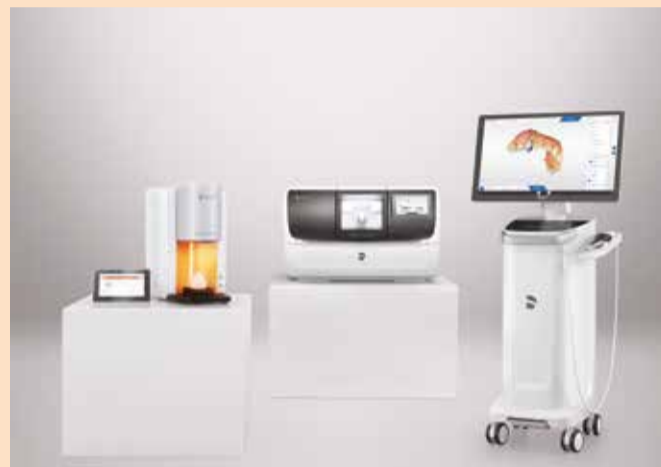
Slika 3: Obnovljeni CEREC sistem. CEREC Primemill pokazao se kao pravi pokretač igre.

CEREC Primemill, nova glodalica kompanije Dentsply Sirona, omogućuje proizvodnju impresivnih restauracija s preciznim rubovima i vrlo glatkom površinom što je rezultat brzine obrade s dve osovine i četiri motora. CEREC Primemill ima snažni 7-inčni interfejs koji se aktivira na dodir, integrisanu kameru za skeniranje blokova s kompatibilnim matričnim kodom podataka i RFID skener za čitanje podataka sa borera. Takođe je kompatibilan sa širokim rasponom materijala. Novi dizajn omogućuje znatno jednostavnije upravljanje i rad.