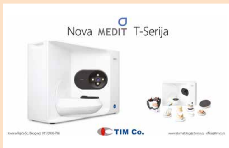
Slika 1b: Desktop laboratorijski skener.

Sledeća faza je dizajniranje prototipa krunica u Exocad DentalCAD programu i kreiranje modela u Exocad model creator-u. (Slika 5).