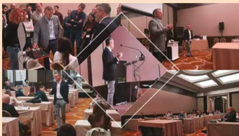
3SHAPE radionica i predavanja u organizaciji DDS Digital Design Solution.

Kroz život poznatog šahovskog velemajstora Gari Kasparova na za-