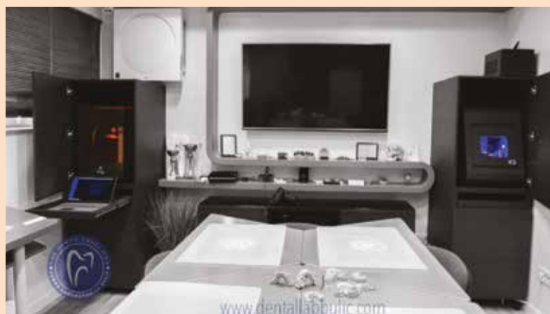
Slika 1c: Izgled zubne laboratorije Bulić, levo 3D štampač DWS XFAB, desno dentalna glodalica Vhf-K5.