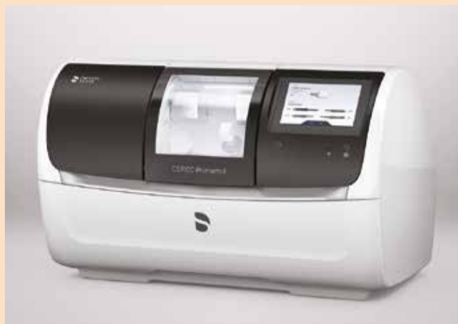
Slika 1: CEREC Primemill - brza izrada, izvrstan kvalitet i jednostavno rukovanje.

CEREC je napravio još jedan veliki iskorak uvođenjem CEREC Primemilla, potpuno nove jedinice za frezovanje i glodanje kompanije Dentsply Sirona. Izrada nadoknada direktno u ordinaciji time postaje znatno jednostavnija i brža. Zahvaljujući vrhunskoj tehnologiji, sada se može proizvesti širok spektar nadoknada mnogo brže i uz izvanredne rezultate. Zajedno s CEREC Primescanom i CEREC softverom, CEREC Primemill upotpunjuje savremeni sistem za postizanje predvidljivih rezultata s potpuno novim iskustvom – i za korisnika i za pacijenta.