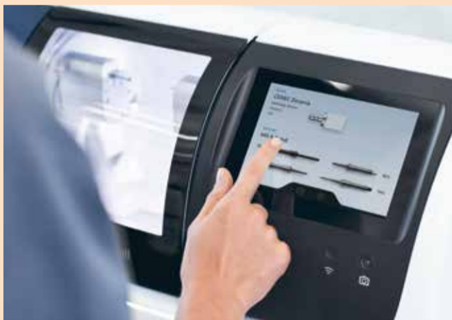
Slika 2: Poznato rukovanje preko interfejsa osetljivog na dodir. Jednostavni i navođeni procesi ubrzavaju tok rada.