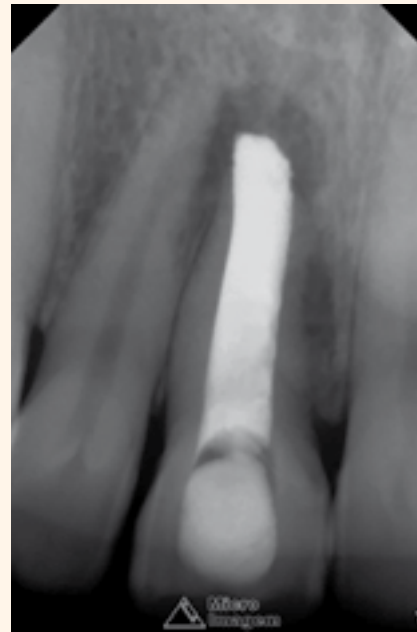
Figura 10. Radiografía final.