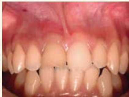
Figura 1. Aspecto clínico del elemento dental 11.