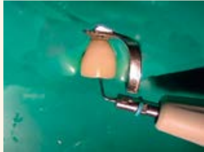
Figura 4. Complementación del proceso de limpieza con el uso de irrigación ultrasónica.

Tras la retirada de la medicación intracanal y secado, la confección del