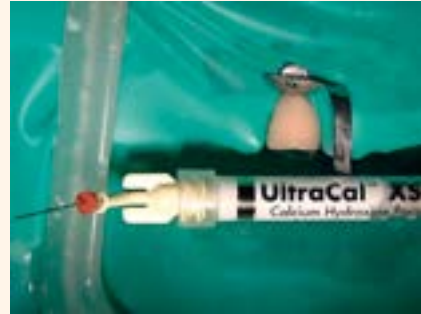
Figura 5. Medicación intracanal con Hidróxido de Calcio.