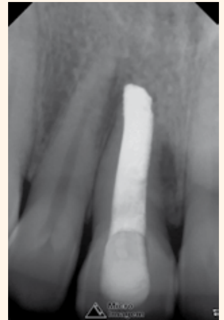
Figura 11. Observación posterior tras 6 meses.

Tras 24 horas, se llevó a cabo la obturación del canal radicular por la técnica termomecánica Híbrida de Tagger con el cemento obturador