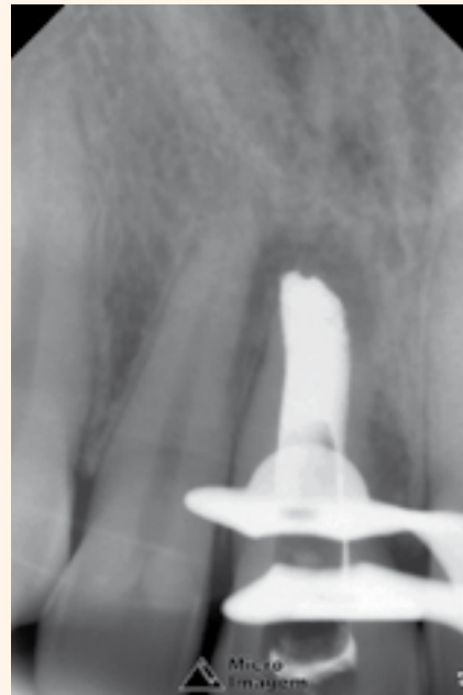
Figura 9. Imagen radiográfica del plug apical.

plug apical fue realizada con MTA REPAIR HP (Angelus/Brasil) (Figura 7), siendo la inserción realizada por la técnica directa a través del empleo de condensadores endodónticos previamente medidos (Figura 8), con el objetivo del llenado y consiguiente sellado de los 4 mm apicales (Figura 9).