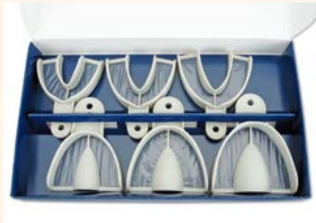
Figura 1. Cubetas de impresión Miratray (Hager & Werken).