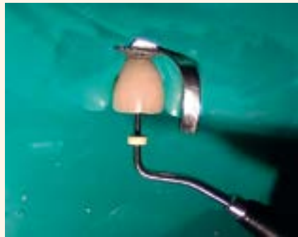
Figura 8. Condensación directa de MTA REPAIR HP.

plug apical fue realizada con MTA REPAIR HP (Angelus/Brasil) (Figura 7), siendo la inserción realizada por la técnica directa a través del empleo de condensadores endodónticos previamente medidos (Figura 8), con el objetivo del llenado y consiguiente sellado de los 4 mm apicales (Figura 9).