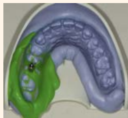
Figura 3. Inspección de la impresión del implante, poste de impresión in situ.