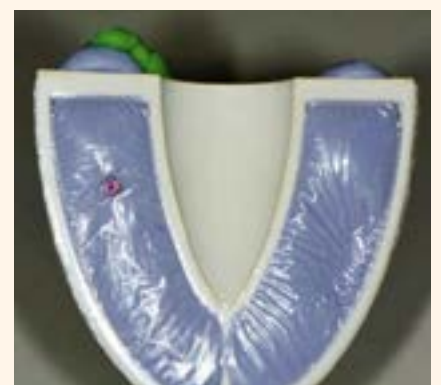
Figura 4. Supervisión de la lámina patentada con tecnología innovadora.