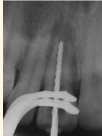
Figura 3. Radiografía de odontometría.

3ª serie (Maillefer/Suiça) procurando dilatar toda la conformación del canal radicular, y como agente irri-