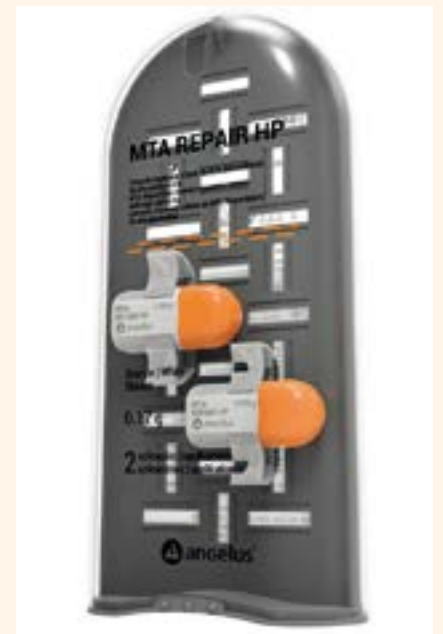
Figura 7. Presentación de MTA REPAIR HP (Angelus/Brasil).