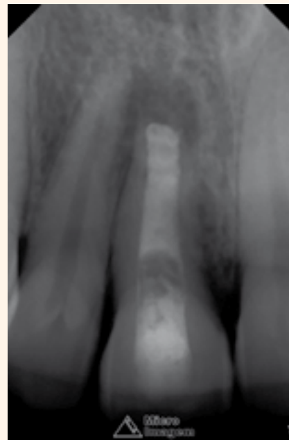
Figura 6. Aspecto radiográfico del llenado del intracanal con Hidróxido de Calcio.