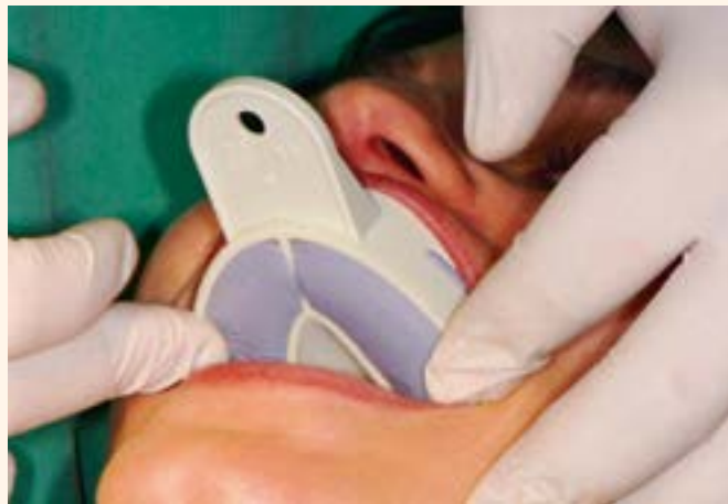
Figura 2. Impresión del implante en la pieza 26 después de la implantación, 4 meses antes.